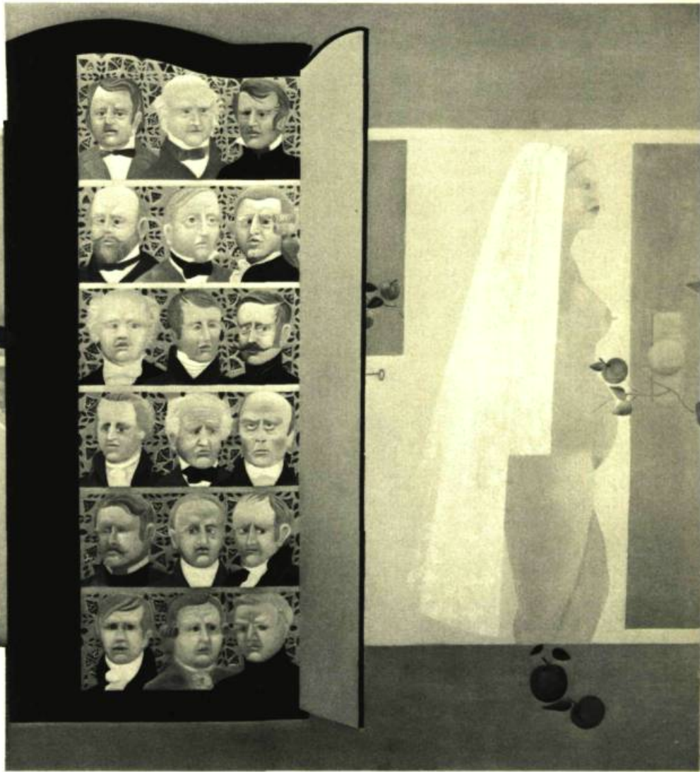
2. Lost-Souls' Cabinet , 1969-1970. 60 po. sur 86½ (152,4 cm. x 219,75) Montréal Coll. Galerie Godard Lefort.

surréal , émanait du subconscient et n'avait rien à voir avec les apparences et que, conséquemment, seule la déraison pouvait mener au grand art. La psychothérapie a rendu désuète la première théorie, et le mouvement automatiste, plus contemporain, a eu raison de la deuxième.