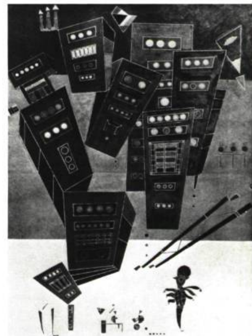
4. Vassily KANDINSKY Ténèbres , 1943. Neuilly-sur-Seine, Coll. Nina Kandinsky.