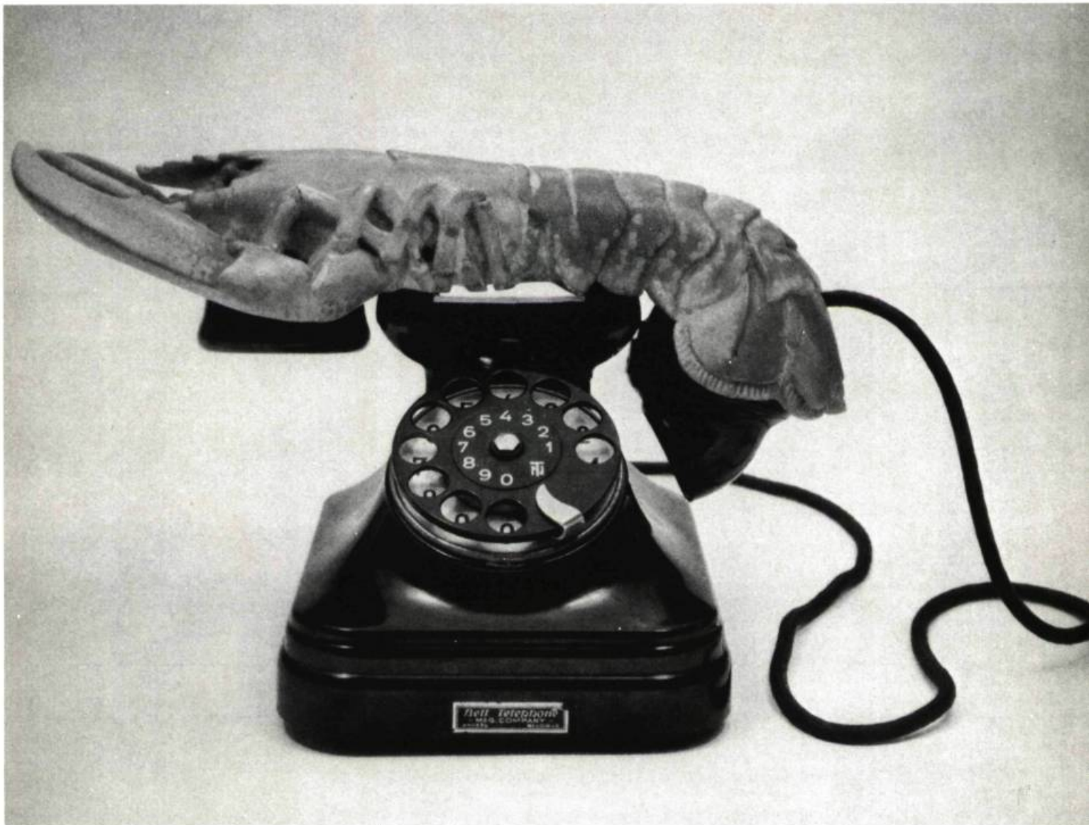
2. Pablo PICASSO Confidence. Paris, Musée National d'Art Moderne, Coll. Marie Cuttoli.