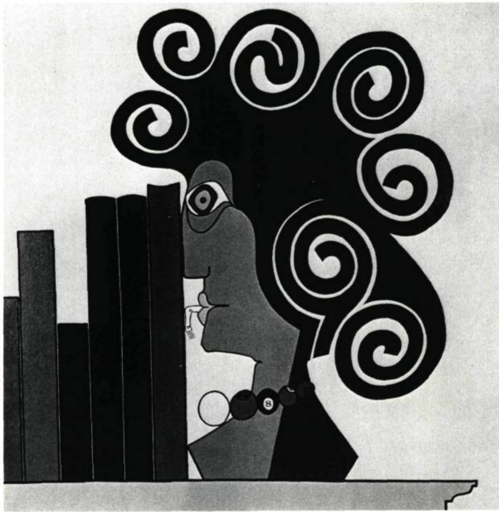
7. L'Appui-livre , 1968. Huile sur bois; 24 po. x 24 (60.9 x 60.9 cm.). Montréal, Coll. Rosario Beaudoin.

Pour aller chez lui, il faut grimper au troisième étage d'un vieil immeuble. La porte d'entrée ouvre sur un corridor aseptique. Il conduit au vivoir meublé avec goût: un vieux bahut qui dissimule le bar; deux fauteuils qu'il a dessinés; une chaise berçante achetée à Sainte-Théodosie; un stéréo susurrant la musique de Il était une fois dans l'Ouest ; sur les murs, des tableaux signés Jean Dallaire: trois ou quatre toiles à la manière des cubistes et, de ce peintre encore, quelques-unes des dernières œuvres, au charme primitif du dessin d'enfants.