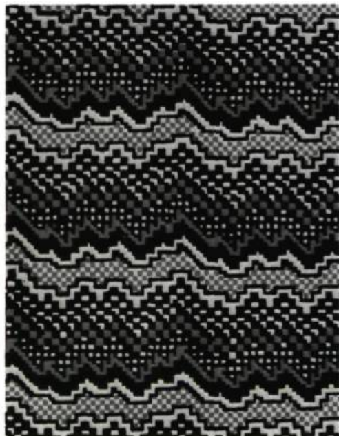
1. Claire MIRON Motifs de tissu inspirés de l'art maya. Fabrication Canadian Textile Co.