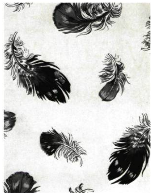
3. Motifs de plumes à la manière des années 30. Fabrication Canadian Textile Co.