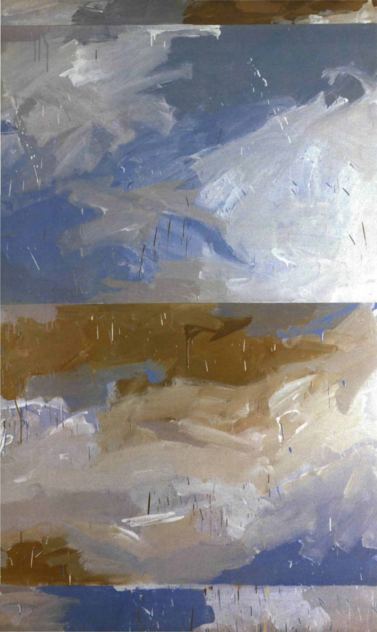
3. Splitscreenspace/Été , 1977-1978. Huile sur toile; 213 cm 4 x 284,5.