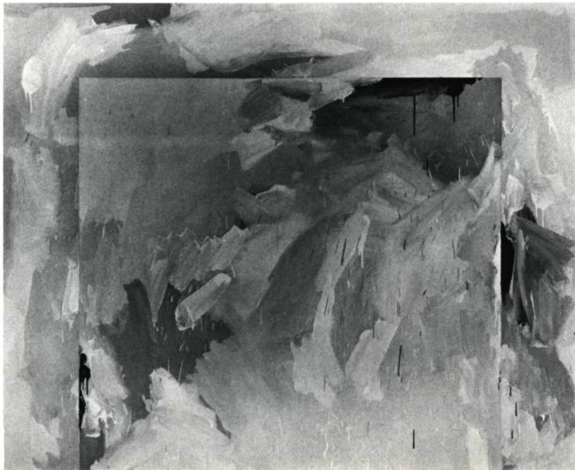
4. Cassation/D'Été , 1978. Huile sur toile; 167 cm 6 x 203.2.