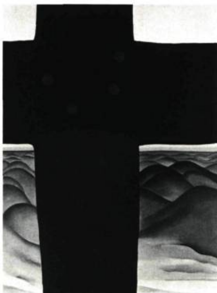
3. Georgia O'KEEFE Black Cross, New Mexico, 1929. 99 cm x 76,35. Chicago Art Institute.

Le désir d'évasion, même en art, est parfois impérieux. Turkiye (États-Unis, Claude Lelouch) nous dévoile les multiples facettes de l'architecture de ce pays d'Orient. Temples, ruines, monuments, mosquées,