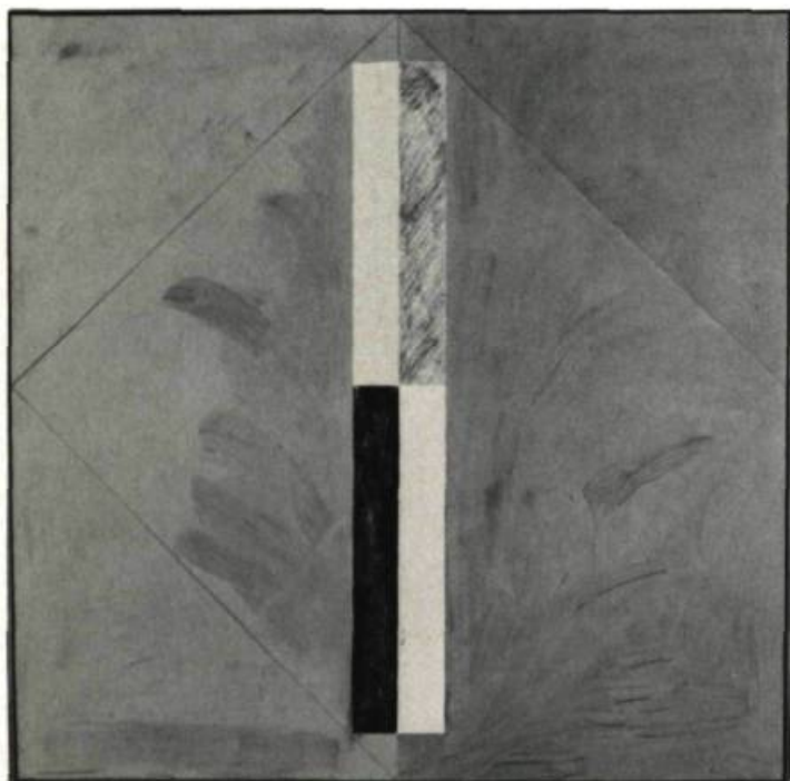
2. Common Sense , 1978. Acrylique sur toile; 1 m 6 x 1,6.