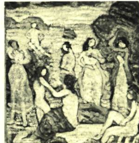
6. Eight Bathers . Huile sur toile. Boston, Musée. (Phot. Museum of Fine Arts, Boston).