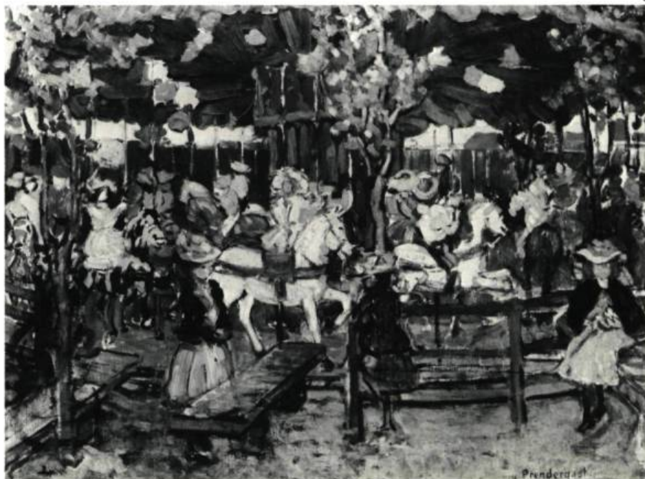
3. The Flying Horses , v. 1901. Huile sur toile; 60 cm 7 x 81,5. Toledo, Musée.