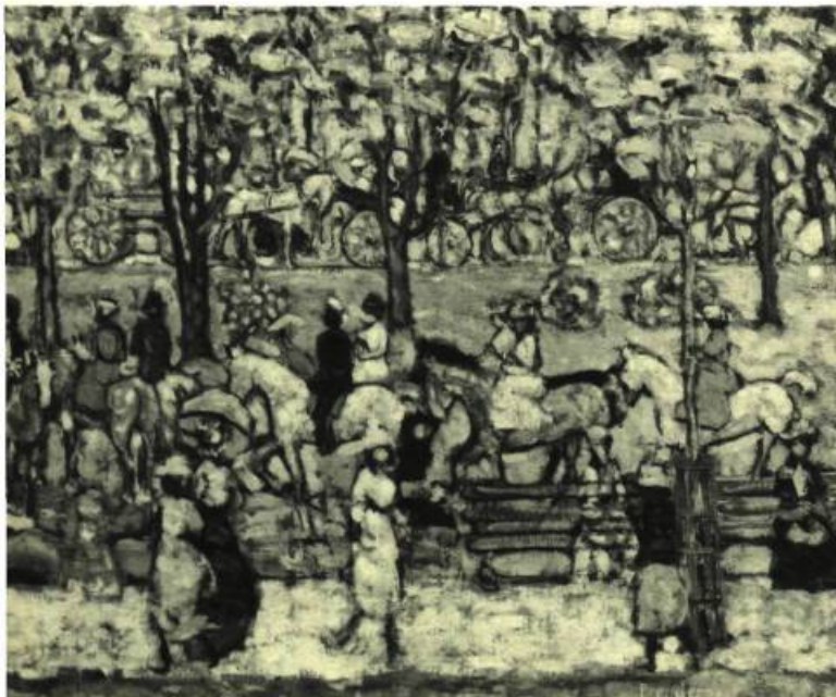
5. Central Park in 1903 . Huile sur toile; 52 cm 70 x 68,58. New-York, The Metropolitan Museum of Art.

Matisse (1904-1905); que ses rares natures mortes évoquent Cézanne. Mais, chaque fois qu'il se rapproche d'un peintre européen par la forme, c'est pour s'en éloigner par la technique: alors que précédemment il ressemblait à Vuillard mais en utilisant l'aquarelle, donc la technique la moins pesante, symétriquement s'il paraît maintenant plus près de Matisse, c'est en l'estant les sujets de la matière la plus lourde, d'une pâte épaisse et coruscante à la Monticelli.