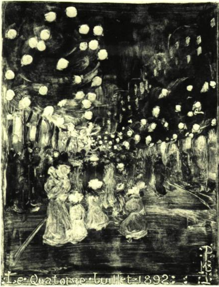
4. Bastille Day (Le Quatorze Juillet) , 1892. Monotype; 304 mm x 247. Cleveland, Musée.