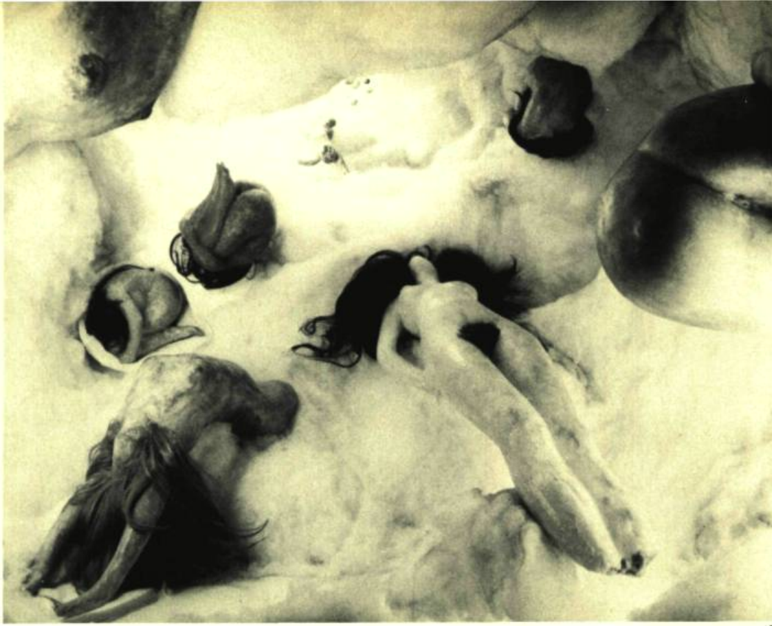
3. La Naissance du petit monstre, 1977-1978. Cire et techniques mixtes; 71 cm 12 x 101,60 x 101,60.