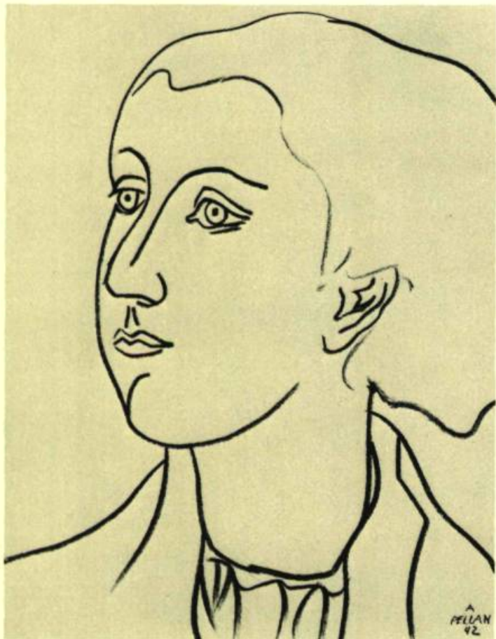
1. Portrait , 1942. Fusain; 55 cm 6 x 40,3. Ottawa, Galerie Nationale du Canada.