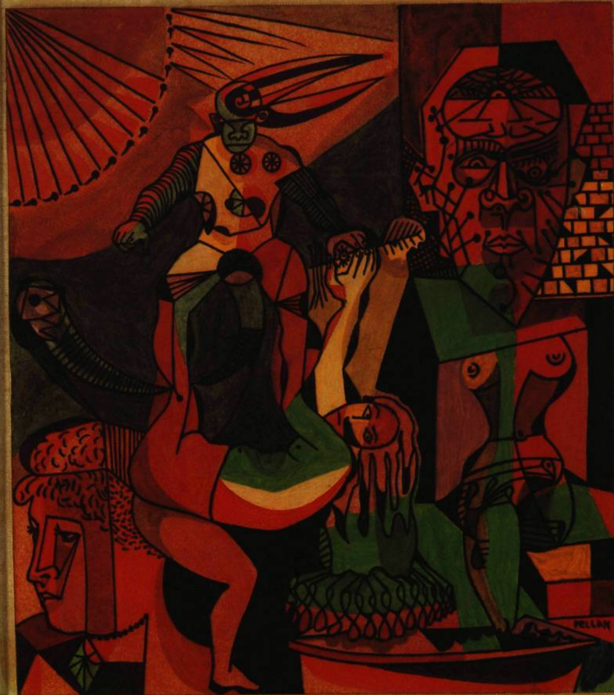
3. Science-fiction . Encre de couleur; 20 cm 3 x 17,5. Ottawa, Galerie Nationale du Canada.