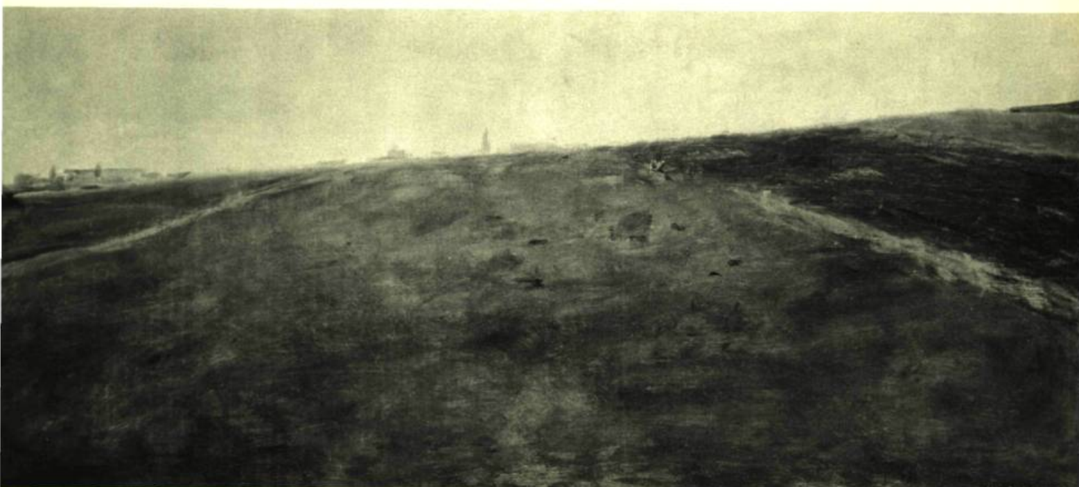
2. La Ville lointaine , 1956. Huile sur toile; 48 cm 9 x 109,8. Ottawa, Galerie Nationale du Canada.

satire, comme dans En famille et The Birds I Have Known . En 1955-1956, trois peintures célèbres marquèrent un tournant: Le Visiteur du soir , Le Train de midi et Le Chemin qui mène nulle part .