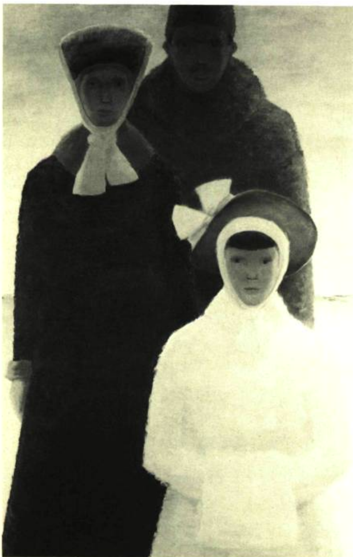
1. Jean-Paul LEMIEUX La Visite , 1967. Huile sur toile; 1 m 70 x 1,06. Ottawa, Galerie Nationale du Canada.

«Avez-vous déjà vu, par un après-midi de janvier, un petit village québécois sur lequel descendent de longues ombres bleues? Ah! la solitude. Oui, je peins la solitude», disait récemment Jean-Paul Lemieux au cours d'une entrevue.