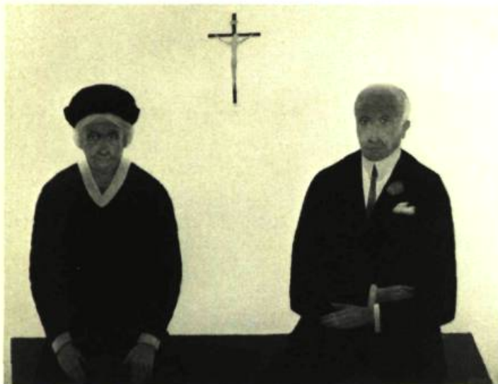
3. Les Noces d'or , 1966. Huile sur toile; 1 m 30 x 1,71. Québec, Musée du Québec.