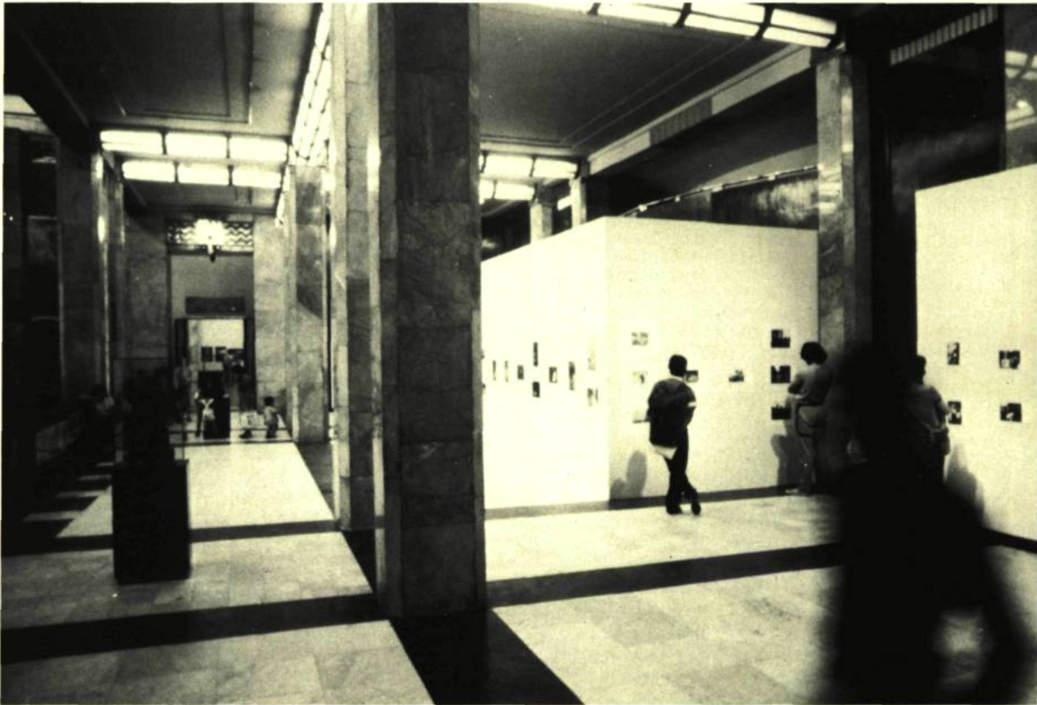
3. Vue partielle de l'exposition principale du Colloque, au Palacio de Bellas Artes.

Hecho en Latinoamerica II ne fut pas un symposium didactique ni scientifique, mais un colloque axé sur une organisation possible des idées. On n'en a pas fait, non plus, un congrès orienté vers l'organisation des intéressés, et il paraît