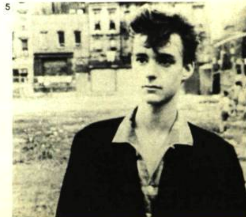
5. Permanent Vacation de Jim Jarmusch.