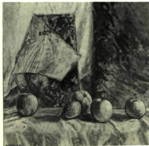
1. Marcella MALTAIS Nature morte, 1982. Huile sur toile.

Pour Marcella Maltais, c'est avant tout la lumière qui permet l'existence des formes. Le sujet n'est désormais qu'un prétexte, jusque dans la vingtaine de tableaux (1980-1984) présentés en juin dernier 2 . Un certain nombre de ces toiles avaient été vues déjà: Maltais ne peint que quatre ou cinq tableaux par année. Pour qui s'arrête strictement à la thématique, cette production paraîtra architraaditionnelle, les motifs qui se retrouvent ici pouvant très bien sembler éculés: une vieille paire de chaussures, un pot de violettes africaines, des citrons dans un panier, un pichet et quelques pommes, des poteries sur un coin de table: voilà pour les «vies tranquilles». Certaines perspectives, de l'écart d'une fenêtre, montreront un chat dormant sur l'allège, avec la jalousie bleue ouverte sur un pan de marguerites jaunes dans le jardin. Ou, pour les scènes d'ex-