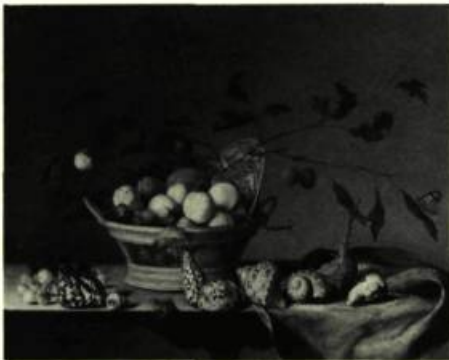
Balthus VAN DER AST

Jusqu'au 2 janvier: Jack Shadbolt; Georg Baselitz; Jusqu'au 20 janvier: La Photographie aux Indes, aux 19 e et 20 e siècles; Du 1 er février au 17 mars: Biennale du Film et de la Vidéo; Jusqu'au 10 février: Peintures hollandaises; À partir du 22 février: Ching Yan Chai - Collection de peintures chinoises, du 15 e siècle à aujourd'hui; À partir du 9 mars: Photographies du quartier chinois de Vancouver, de 1886 à 1984; À partir du 15 mars: Routes de la soie et bateaux de Chine.