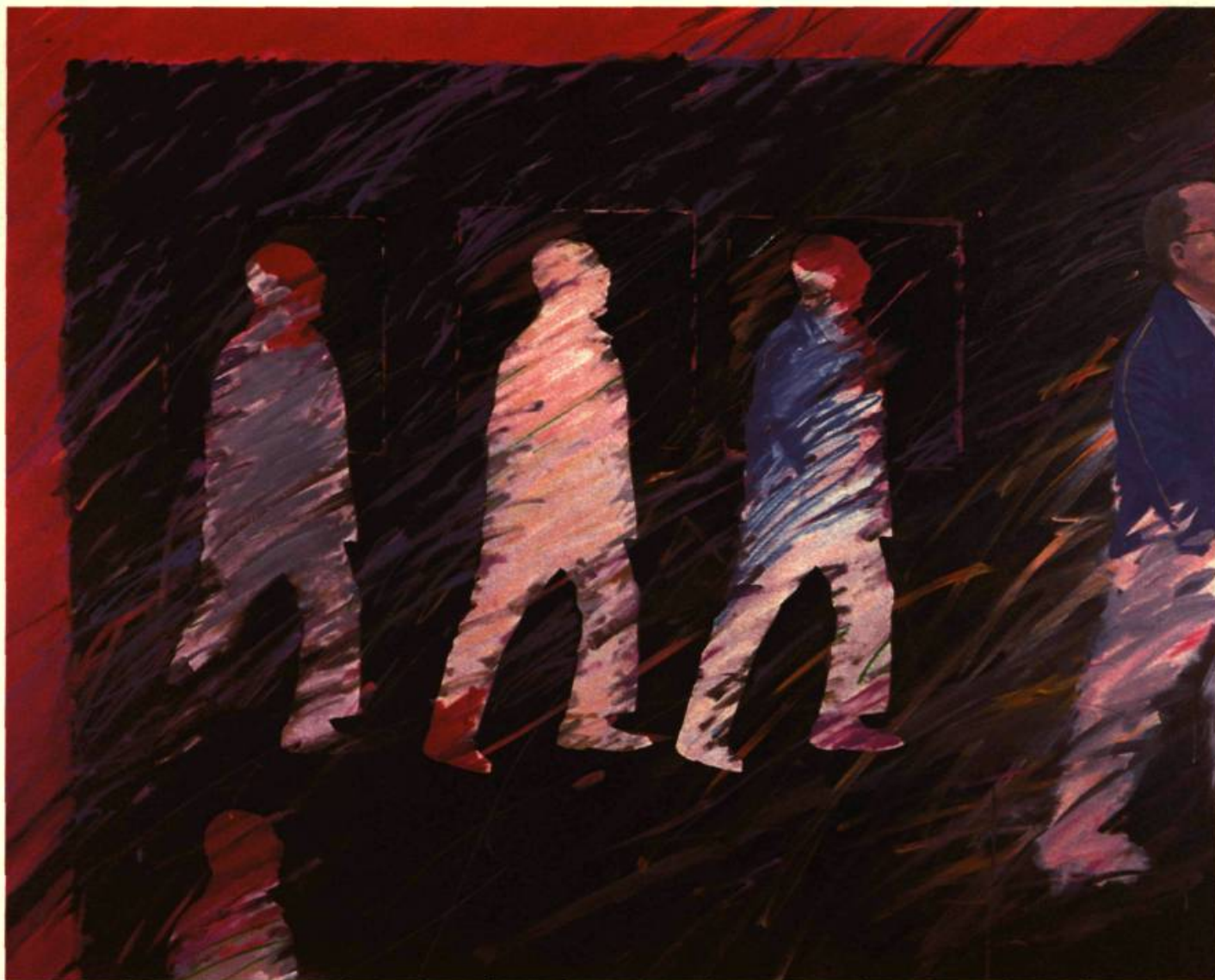
2. En broyant du Blues, 1984. 137cm l x 167,6.

lise, je les change de situation, je les remêle avec d'autres personnages, avec d'autres situations, d'autres fonds, d'autres ambiances. Mais, au départ, il y a toujours une photo, le personnage a été photographié. C'est comme l'arrêter dans une situation, puis après, le réutiliser. C'est une recherche du temps par un mouvement, un déplacement, une répétition du même personnage...»