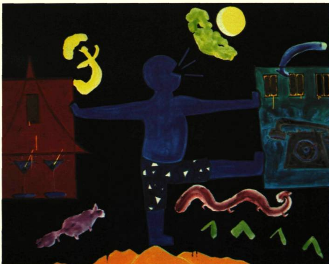
2. Eric SLUTSKY I'm Checkin' out , 1983. Huile et pastel sur toile; 135cm x 173.