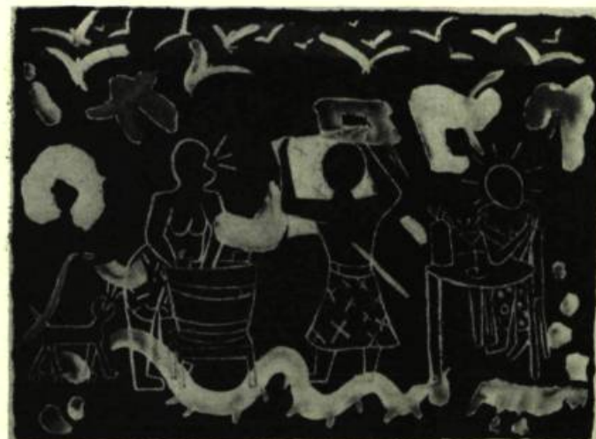
3. Trois femmes , 1983. Huile sur toile; 134cm 6 x 172,7.

tiste. Même animées, même narratives, les toiles d'Eric Slutsky demeurent abstraites en ce sens qu'elles ne livrent pas tout du premier coup et que ce n'est pas non plus ce qu'on leur demande. Elles exigent toutefois une lecture attentive. Il s'agit d'entrer dans un monde; les points de repère sont là: un ensemble de signes et de symboles que l'on apprend à distinguer et qui sont en réalité proches de la voix de l'auteur, de son humour, de son jugement caustique. Il est sans doute aléatoire de s'interroger sur le leitmotiv des fonds noirs, mais on ne peut s'empêcher d'évoquer la tradition chinoise (le ch'i) qui divise le monde en terre, feu, eau, or et bois, et dont le noir, une manifestation de l'eau, symbolise la force d'attraction des pouvoirs, y compris le monétaire.