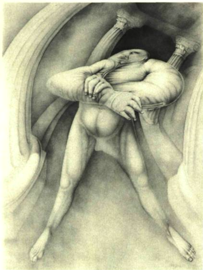
1. RECONDO Personnage aux colonnes, 1983. Mine de plomb sur papier; 120cm x 160.

Depuis le plus haut Moyen-âge du rewardant – flirtant avec l'ancien espagnol reguardo et l'italien riquardo – jusqu'à l'illusionnisme scintillant de la drague, le mot regard n'a point perdu son sens possessif de garder , d'envelopper, voire de rejeter, qu'enserme le mot regarder . De l'éréthisme le plus insolent à la pudeur dépouillée, le corps de l'œuvre appelle une fascination qui devient par là même la première extrémité du détachement. Du moraliste au farfouilleur, l'œil scrute et décrypte les appels d'un lointain imaginaire et, par le truchement de l'œuvre vue, retranscrit une écriture intérieure. Que le peintre regarde droit, de travers, de côté, du coin de l'œil ou encore avec le prisme de l'orgueil ou du dédain, il se donne en spectacle aux mille janissaires du sérail interrogatif. Car, s'il est vrai que nos yeux voient nécessairement tout ce qui fait impression sur nous, il ne suffit pas de voir pour vraiment entrevoir la fenêtre de toutes les lumières; tant il est vrai, écrivait Goethe, que «l'antinaturel aussi fait partie de la nature. [Et] celui qui ne la voit point partout, ne la voit point nulle part». De l'ancre noir des gouffres profonds que l'artiste semble avoir fait surgir de l'ombre, s'écrivent des visages secrets, comme si le voyeur creusait un tombeau pour les derniers vivants.