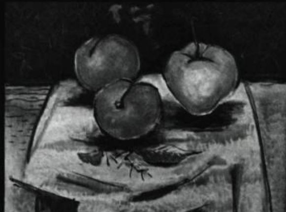
Paul-Vanier BEAULIEU - Nature morte aux pommes , 1953. Huile sur toile.

2, COMPLEXE DESJARDINS, BUREAU 2600 C.P. 153, MONTRÉAL, H5B 1E8 TÉL.: (514) 281-1555 TÉLEX: 055-60917