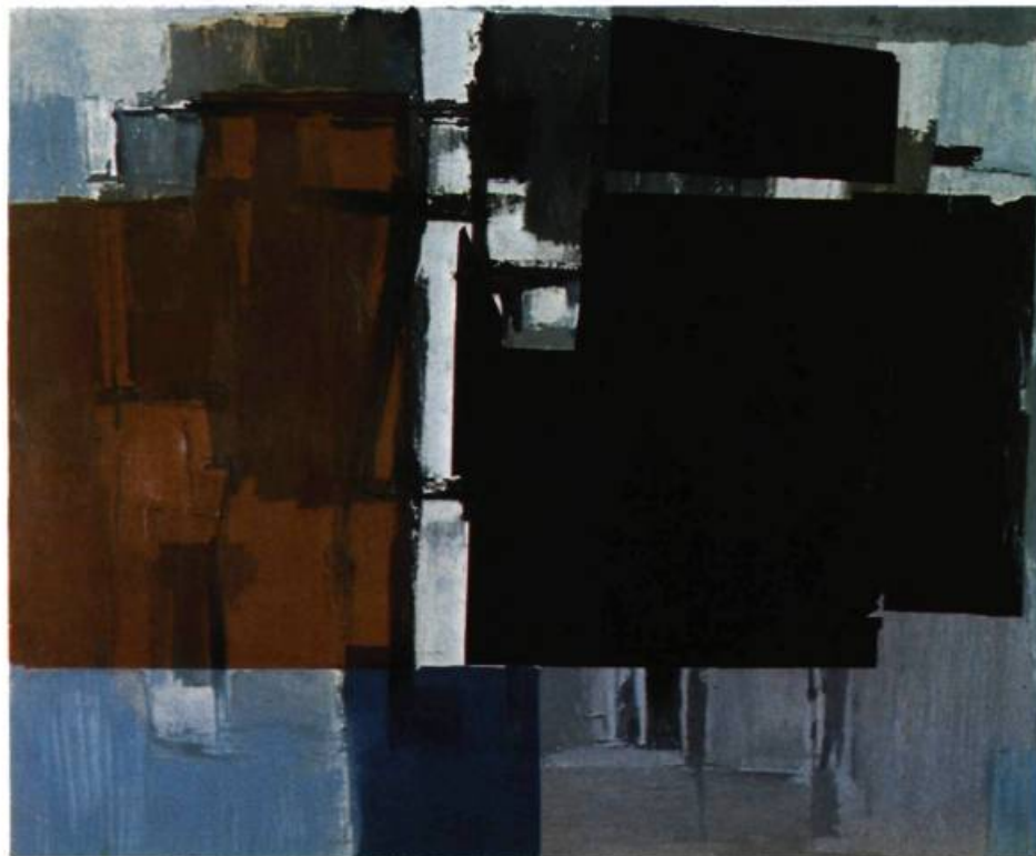
3. Mycènes , 1968. Huile et collage; 76 cm 2 x 91,4.