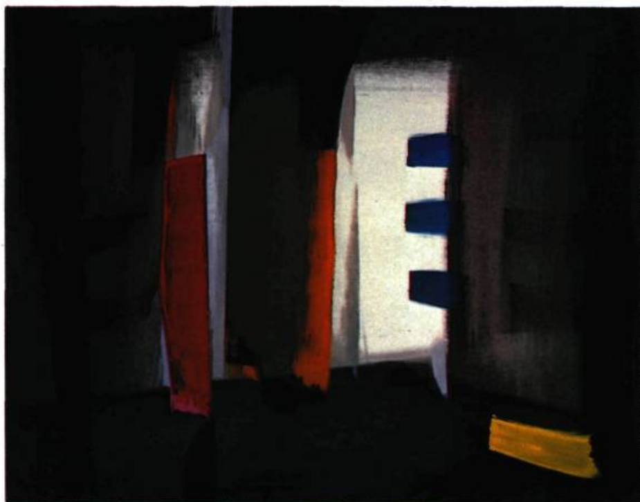
2. Loggia , 1954. Gouache; 48 cm 2 x 61.

fidélité une recherche abstraite que tant d'autres ont abandonnée avant terme. En 1969, quand l'École des Beaux-Arts a été intégrée à l'Université du Québec à Montréal, il a entrepris des recherches techniques sur la couleur qui ne sont pas à proprement parler, pour lui, une entreprise esthétique. Mais on sent, dans cette démarche tout à fait singulière à un moment où d'autres se seraient reposés, comme une volonté de percer ce qu'il faut bien appeler le cul-de-sac de l'expression abstraite.