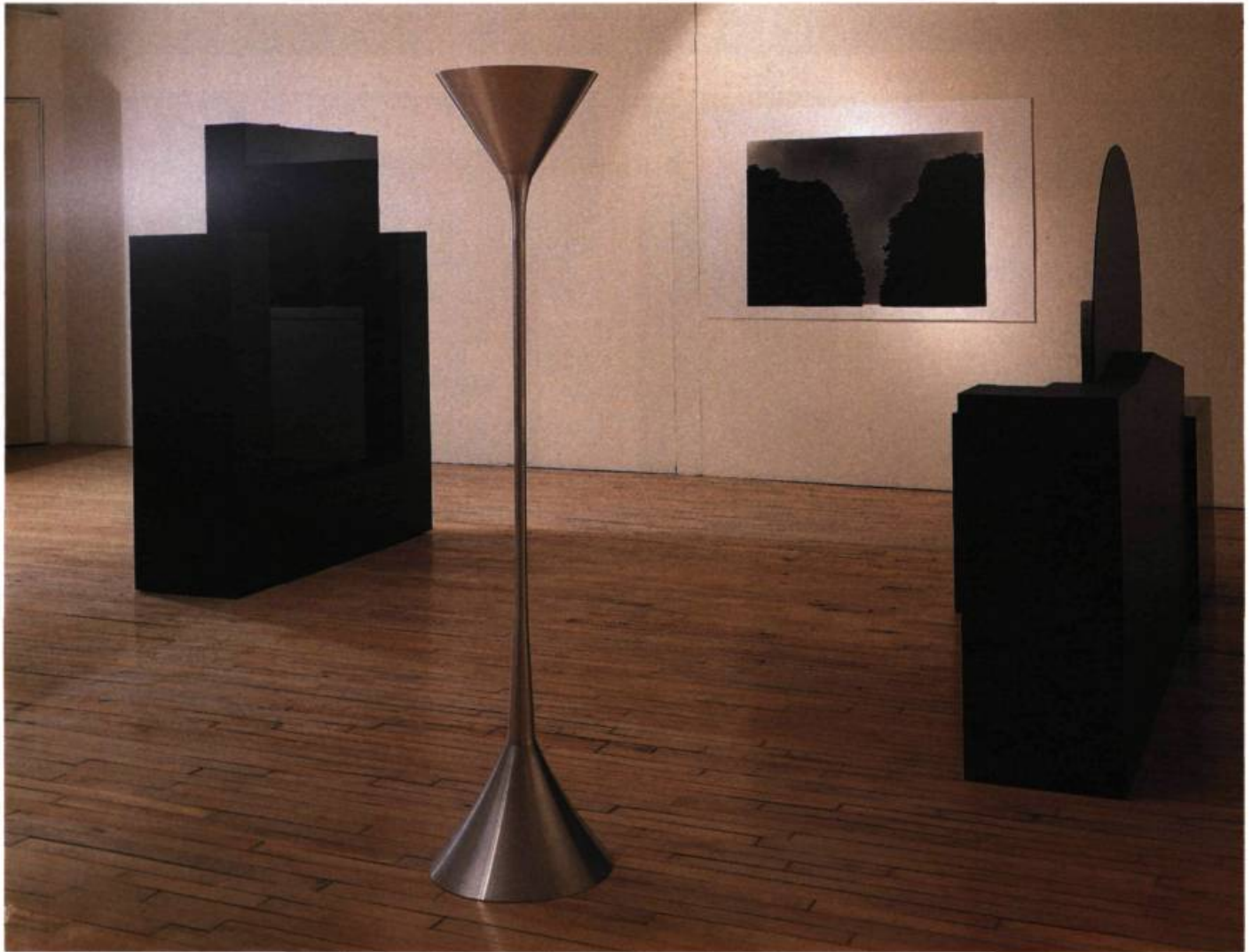
Jocelyne Alloucherie Sans titre , 1989.