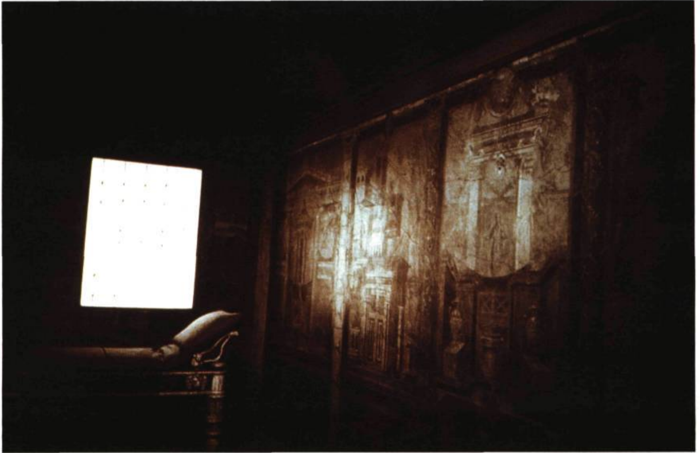
Angela Grauerholz Interior , 1988.

ce qu'elles peuvent correspondre à des centaines d'endroits et susciter en même temps cette étincelle particulière, cette émotion de souvenir vague qui hante aussi les œuvres d'Angela Grauerholz, «qui fait revenir à la conscience amoureuse le Temps», écrivait Roland Barthes, celui de l'extase photographique.