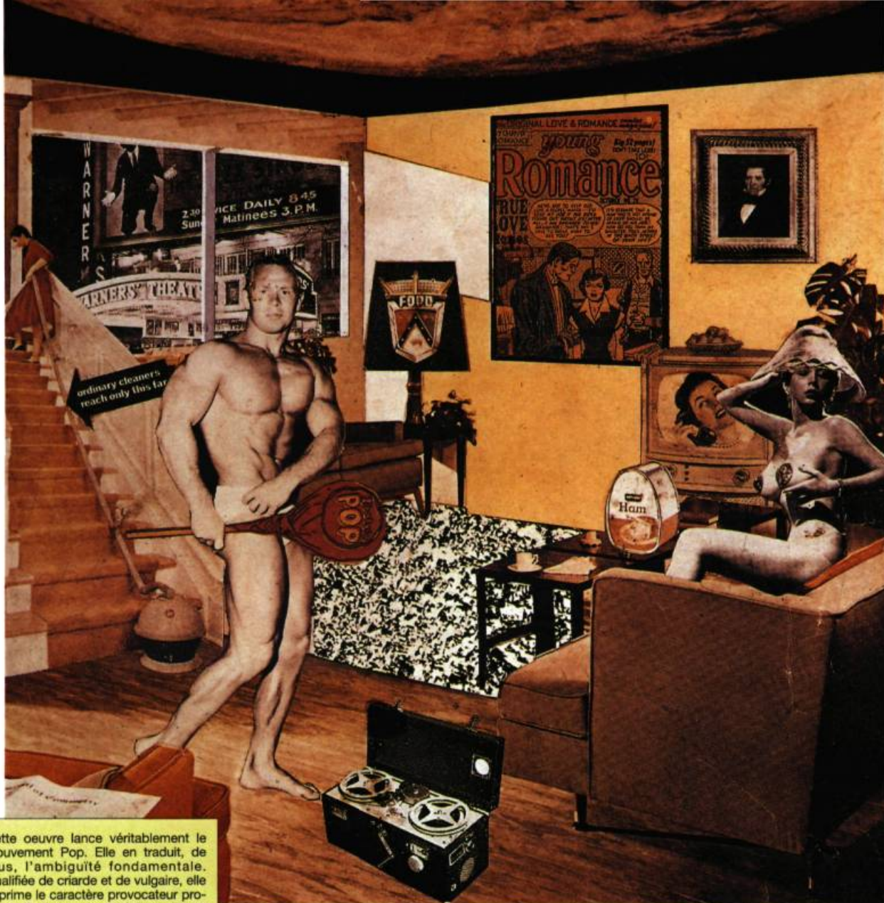
Richard Hamilton 1956