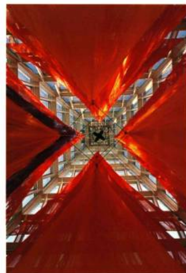
Je veux la lune, 1994 Installation, Hotel de ville d'Ottawa

Peu nombreuses sont les expositions collectives offertes aux jeunes artistes contemporains à l'extérieur des frontières de notre pays, et, à fortiori, hors des sentiers battus qui mènent à