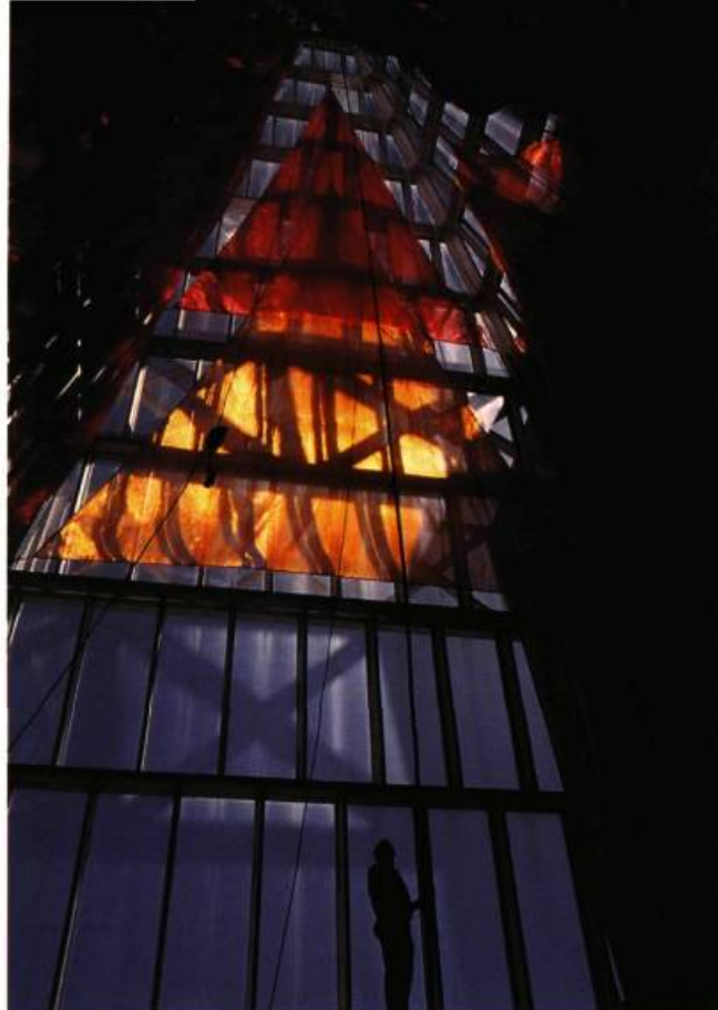
Je veux la lune, 1994 Installation, Hotel de ville d'Ottawa

Oryx Energy a ouvert son concours international (toutes disciplines confondues) en octobre 1991, à quelques artistes soigneusement sélectionnés. En choisissant la maquette du lissier québécois, la compagnie américaine ne désirait pas une tapisserie qui traiterait comme tel du pétrole, mais qui permettrait plutôt de sentir la vocation de l'entreprise. Résultat: «L'or noir» de Micheline Beauchemin est une œuvre plus figurative que ce que cette artiste a l'habitude de