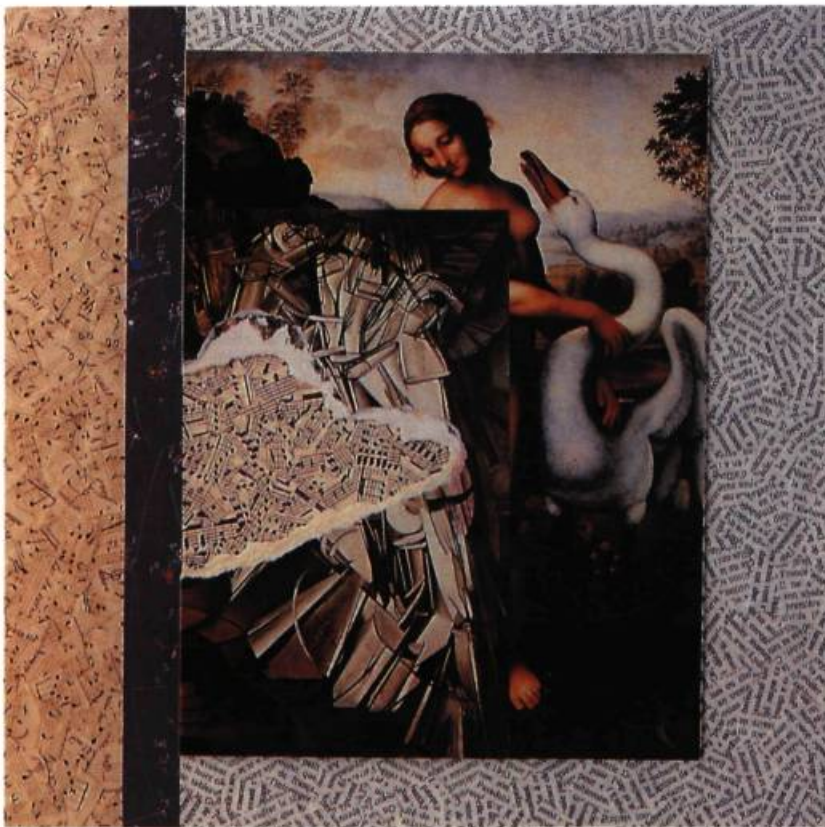
Autrefois à Rome, sortant d'une exposition Dada, j'ai croisé monsieur D., déguisé en Léda, menant en laisse un immense cygne chantant, 1991 40 x 40 cm

■ Des méthodes: quelles méthodes? Y en aurait-il plusieurs? Et depuis quand? Y en aurait-il tellement qu'il faille les ordonner, les catégoriser, les classer, les nommer? Et selon quel procédé raisonné ou raisonnable — quelle méthode ou quelle méthodologie — selon quelle règle agir?