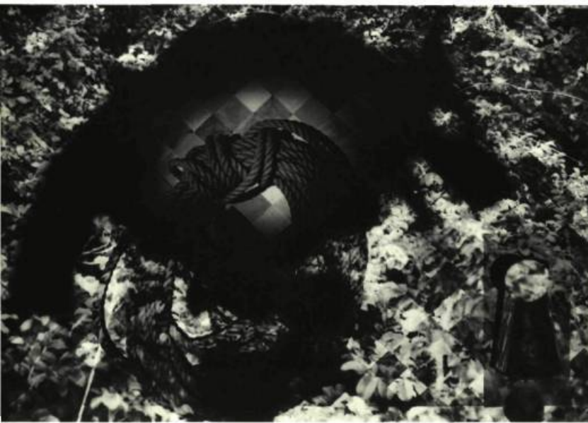
Jardin américain n° 2, (Lupus) Photographie couleur, 1993-1994 103 X 145 cm