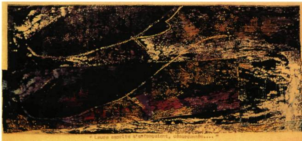
Leurs esprits s'enfonçaient, désordonnés... Tapisserie, 1988-1989 Tapisserie Haute-lice, laine naturelle