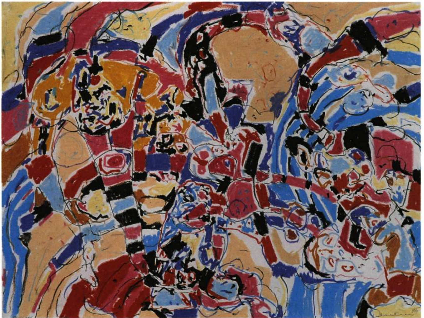
Pastel-26, série Oaxaca, 1995 46 x 60 cm

Sacrifice ou sacrilège, le dessaisissement 1 de Migration par son créateur restera toujours aux yeux de certains (l'écrivain Pierre Vadeboncoeur est de ceux-là), une perte déplorable. Perte matérielle, certes, mais non définitive, puisque l'œuvre, préservée dorénavant dans notre mémoire collective, y poursuit ses migrations. Libéré du poids de la démesure de son propre projet, l'artiste