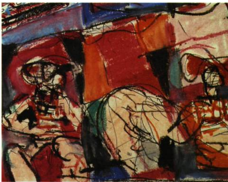
Pastel, 29 novembre 1987 20 cm x 22 cm

Au bas de chacun des panneaux de bois apparaît en relief une grille de silhouettes informes évoquant les photographies gravées des personnages tirés du projet Migrations formant la murale Fleuve-Mémoires présentée en 1994 à Baie-Saint-Paul. Mémoire informatique, code génétique ou écriture ancienne, ces motifs rappellent également les images répétées en série sur les stèles funéraires précolombiennes. La richesse d'évocation des Territoires obscurs tient à l'intégration cohérente de différents éléments puisés dans la mémoire de l'artiste.