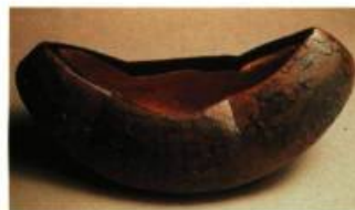
Steven Heinemann (Ontario) Untitled 26 x 76 x 36 cm