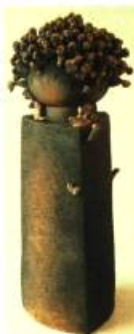
Nicole Nadeau (Québec) Monument à une malade non-imaginaire 80 x 25 x 25 cm