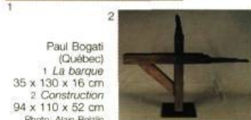
Paul Bogati (Québec) 1 La barque 35 x 130 x 16 cm 2 Construction 94 x 110 x 52 cm