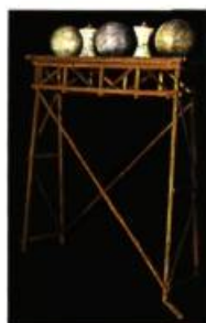
Patrick L. Bureau (Alberta) The Gamiture and the Bridge 142 x 107 x 86 cm