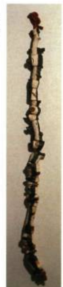
Shelly Low (Québec) Stalk 165 15 x 13 cm