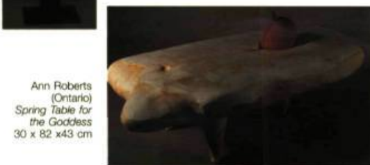
Ann Roberts (Ontario) Spring Table for the Goddess 30 x 82 x 43 cm