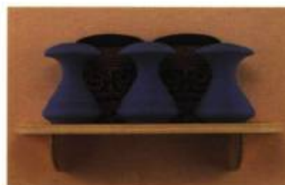
Gregory Payce (Alberta) Vase Pair # 2 22 x 51 x 18 cm