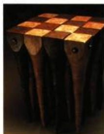
Jeffrey Kneebone (Ontario) Stalactite Table 63 x 45 x 45 cm