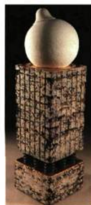
Bruce Taylor (Ontario) Salt Shaker 82 x 22 x 22 cm