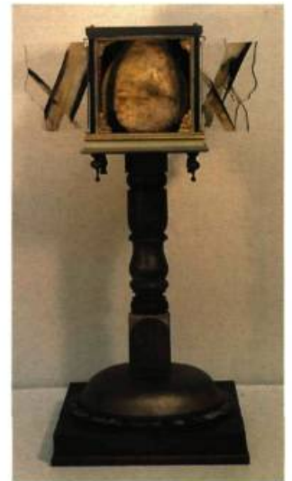
Tony Urquhart (Ontario) Terre en transit 140 x 39,5 x 38 cm

Les volets de plexiglass qui entourent la cage peuvent être placés dans des positions permettant une lecture différente de la pièce. De plus, la partie sphérique au centre semble tourner sur elle-même. D'où le titre: Terre en transit .