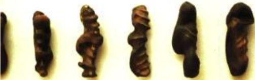
Marsha Kennedy (Saskatchewan) In the Gold of the Flesh (détail) 30 x 400 cm

Les volets de plexiglass qui entourent la cage peuvent être placés dans des positions permettant une lecture différente de la pièce. De plus, la partie sphérique au centre semble tourner sur elle-même. D'où le titre: Terre en transit .