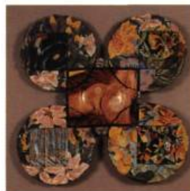
Paul Mathieu (Québec) L'aboutissement du vide 99 x 95 x 7 cm