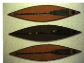
Patrick C. Whiteley (Québec) And the Ocean Cried Blue Murder 100 x 165 x 6 cm