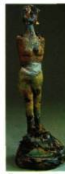
Stephanie Bowman (Saskatchewan) 1 The Prophetess 86 x 18 x 18 cm 2 The Gift 80 x 18 x 20 cm