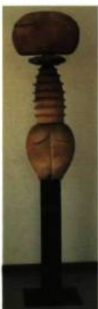
Susan Low-Beer (Ontario) Still Dances XII 180 x 42 x 16,5 cm