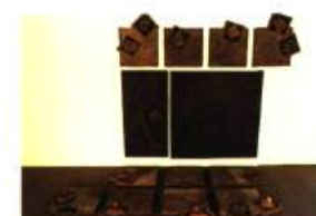
Patricia Gauvin (Québec) Terre en transit 174 x 285 cm