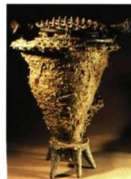
Jim Thomson (Ontario) Winter Salad 55 x 41 x 35 cm