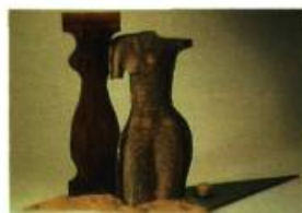
Eva et Milan Lapka (Québec) Menace sur l'environnement bouleversé 77 x 110 x 45 cm