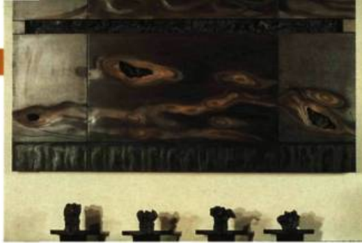
René Derouin (Québec) Tiempo y continuidad II - Los arboles de la vida 112 x 183 cm

Les trois artistes invités par les membres du jury ne produisent habituellement pas d'œuvres de céramique. Néanmoins leurs activités de création polyvalentes les prédisposent beaucoup à travailler l'argile comme l'atteste la qualité des pièces qu'ils ont réalisées pour la Biennale.