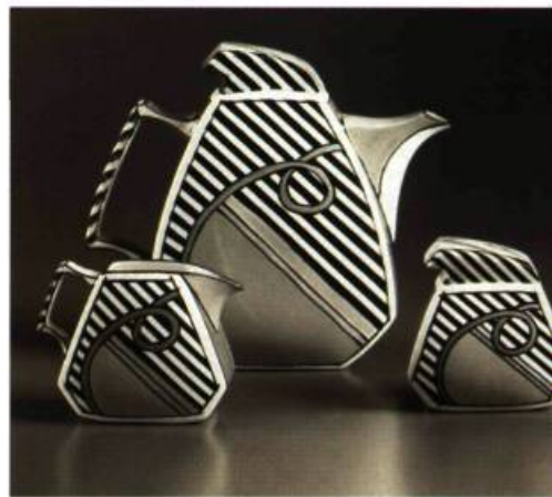
Dorothy Hafner Service à café Fred Flinstone, Flash Gordon et Marie Antoinette Blue Loop with Headress 1984 Faïence émaillée Musée des Arts décoratifs de Montréal

L'exposition Le Plaisir de l'Objet montre à quel point la figure humaine est un « thème sous-jacent à tout le XX e siècle »,