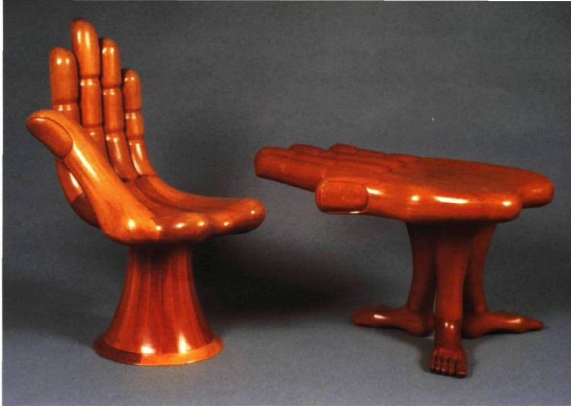
Pedro Friedeberg Fauteuil de Baphomet et table de Baphomet Acajou 46 x 87 x 59 cm 1961-1977 Musée des Arts décoratifs de Montréal

La chaise fait partie des objets dans lesquels se projette facilement l'imagination des créateurs. Ainsi les fauteuils Clarisse et Charly créés par Niki de Saint-Phalle au début des années 80. Clarisse a des souliers rouges, bien visibles, et un grand cœur, sa robe est faite de carrés de couleurs, et elle attend patiemment qu'on vienne s'asseoir sur elle. Quant à Charly, ce qui le distingue derrière ses lunettes rondes, c'est son air vaguement indifférent, peut-être résigné ou paisible. Les pieds bien ouverts, il attend lui aussi d'offrir son corps comme soutien à celui ou celle qui viendra s'y asseoir. Non loin de là, le fauteuil de Baphomet créé en 1961 par Pedro Friedeberg, intrigue par son étrangeté. Le texte nous apprend que Baphomet était une créature mi-ange, mi-démon qu'adoraient les Templiers. Il avait 666 enfants, en mangeait un de temps à autre et avait participé aux Croisades, notamment aux sièges de Constantinople et de Jérusalem. On raconte que les pouvoirs magiques de Baphomet se transmettent à quiconque reste assis 666 minutes dans cette chaise. Mais la forme humaine en a aussi inspiré d'autres, ainsi cette agréable surprise d'un vase tripode à deux faces créé en 1951 par un certain Pablo Picasso. À elle seule cette pièce vaudrait le détour. Faïence émaillée,