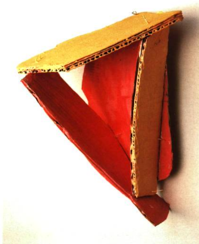
Masque 1997 Acrylique sur carton, 27 x 22 x 17cm.

En effet, l'œuvre de Calder brouille avec jubilation le champ traditionnel des disciplines. A la fois peinture et sculpture, ses créations télescopent à plaisir les notions d'espace à deux et à trois dimensions. Comme Calder dans ses mobiles, Jean Noël dans ses sculptures cherche et trouve le juste point de jonction. Et comme les œuvres de Calder encore, elles sollicitent le spectateur et son sourire afin d'éprouver jusqu'à l'extrême la « limite nécessaire » qui est le secret de l'émerveillement. □