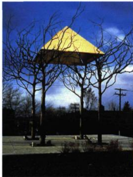
Le Vent se lève Sculpture École des Hautes Études Commerciales de Montréal

d'enregistrer, d'examiner et d'expliquer toutes choses? L'artéfact muséal, qu'il soit un objet culturel ou un spécimen naturel, est collectionné pour donner un sens à l'histoire mais le voilà maintenant transformé en vestiges d'un langage perdu dont les significations premières sont compréhensibles bien qu'elles soient obscures. Notre civilisation se trouve dans un cul-de-sac : il semble vain d'essayer de redéfinir le sens du progrès à une époque où l'état de notre planète est menacée. On peut voir un jeu