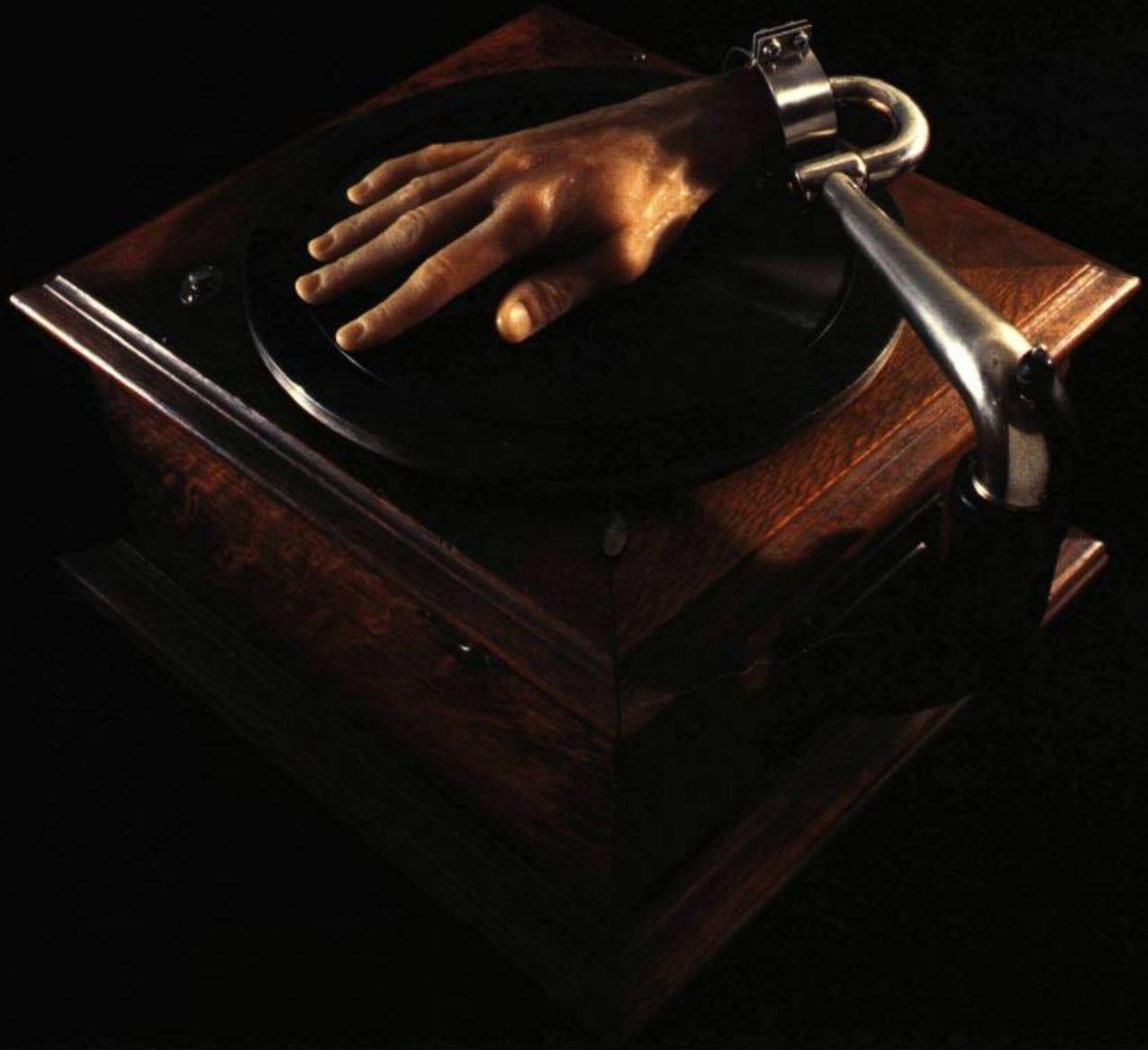
Main de cire et phonographe

T ELS DES POÈMES SURRÉALISTES, LES ASSEMBLAGES DE CATHERINE WIDGERY JUXTAPOSENT DES OBJETS MUSÉAUX À DES ÉLÉMENTS NATURELS