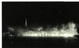
Lumière et silence

Lumière et silence , une ligne de feu signée par le sculpteur québécois André Fournelle a croisé les eaux de la Seine, à la hauteur du Pont des arts, le 20 juin dernier à la tombée de la nuit. Lors de cet événement qui s'inscrivait au programme du Printemps du Québec à Paris, deux fusées projetées de chacune des rives de la Seine traçaient un «X» lumineux dans le ciel, symbole omniprésent dans l'œuvre d'André Fournelle. Puis un rideau incandescent suspendu à trois mètres au-dessus de l'eau balisait un trajet: celui de la «ligne» de feu qui formait ainsi un paysage inattendu entre les deux rives. C'est l'historien de l'art, Pierre Restany, qui a procédé à la mise à feu.