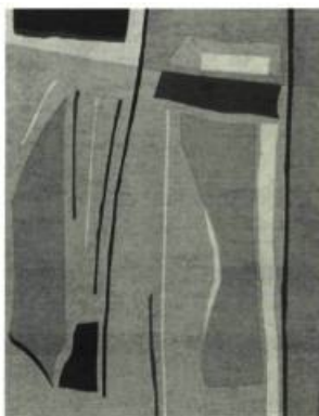
Stone Laine, 3 x 4,3 m