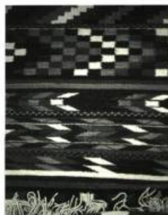
Détail de la couverture tissée 3 x 1,5 m

Pour commémorer la Journée nationale des Autochtones, une magnifique couverture tissée par les artistes Debra et Robyn Sparrow a été dévoilée le 20 juin dernier au Musée Anthropologique de l'Université de la Colombie-Britannique à Vancouver. Ces artistes originaires de Musqueam contribuent par leur art à faire revivre une tradition millénaire. La pièce très colorée de 3 m sur 1,5 m est placée bien en vue à l'entrée des salles d'exposition. L'œuvre a été subventionnée par le Conseil des arts du Canada.