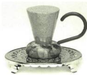
Tasse verte à l'anse rouge, 1999 4 3/4 X 6 3/16 x 4 5/8 pouces

Le récipiendaire 1999 du Prix national d'artisanat Jean A. Chalmers, le céramiste montréalais Léopold L. Foulem, expose ses plus récentes œuvres du 7 au 30 octobre à la Prime Gallery de Toronto. Elles consistent en une série de tasses faites à partir d'objets trouvés et de céramique.