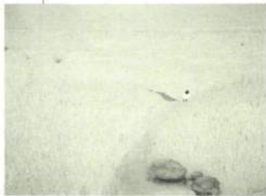
Bord de mer, 1998 Huile sur toile, 81,5 x 112 cm

Elles sont suggestives et séduisantes les toiles de Christian Thibault! Des figures fragiles (humaines) s'opposent à des masses (des rochers) dans des espaces aussi lumineux qu'infiniment neutres (plages) et que, par conséquent, l'on ne finit pas d'observer (séduction,