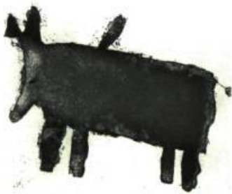
Sheojuk Aopilatunguak, 1997 Gravure rehaussée à l'encre