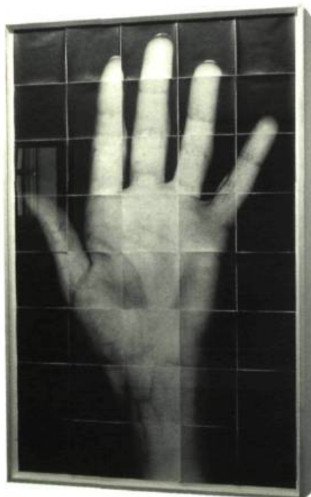
Quarante instants , 1998 Papier baryté, carton, bois, épingles à spécimen, 184 x 122 cm Galerie de l'UQAM

résulte 63 prises de vues représentant autant de négatifs. Réunies et assemblées, les photographies imprimées forment une mosaïque à grande échelle de la figure des modèles. Pour imiter l'effet de miroir, le photographe crée une deuxième figure à partir des négatifs inversés. Ce qui nous est donné à voir, c'est la reconstitution détaillée des parties de l'anatomie des visages formant par la suite un ensemble imposant mesurant plus de trois mètres de hauteur. L'artiste a littéralement balayé (scanned) la morphogénèse de la figure humaine rendant perceptibles des éléments que l'œil nu ne peut voir. La précision extrême du détail des fragments de peau grossis engendre la représentation d'un sujet plus vrai que nature comme si on avait voulu l'examiner sous la loupe de la lentille de l'appareil. Sommes-nous en présence d'une réalité simulée, d'irréalité ou même d'hyperréalisme ? C'est comme si c'était tout cela à la fois tellement le visage humain est révélé sous une apparence inhabituelle, que seule la méthode inductive de Pellegrinuzzi a permis de constituer. Les Écorchés nous offre donc un bel exemple d'une démarche artistique raisonnée entraînant et statuant une perception nouvelle de l'anatomie humaine.