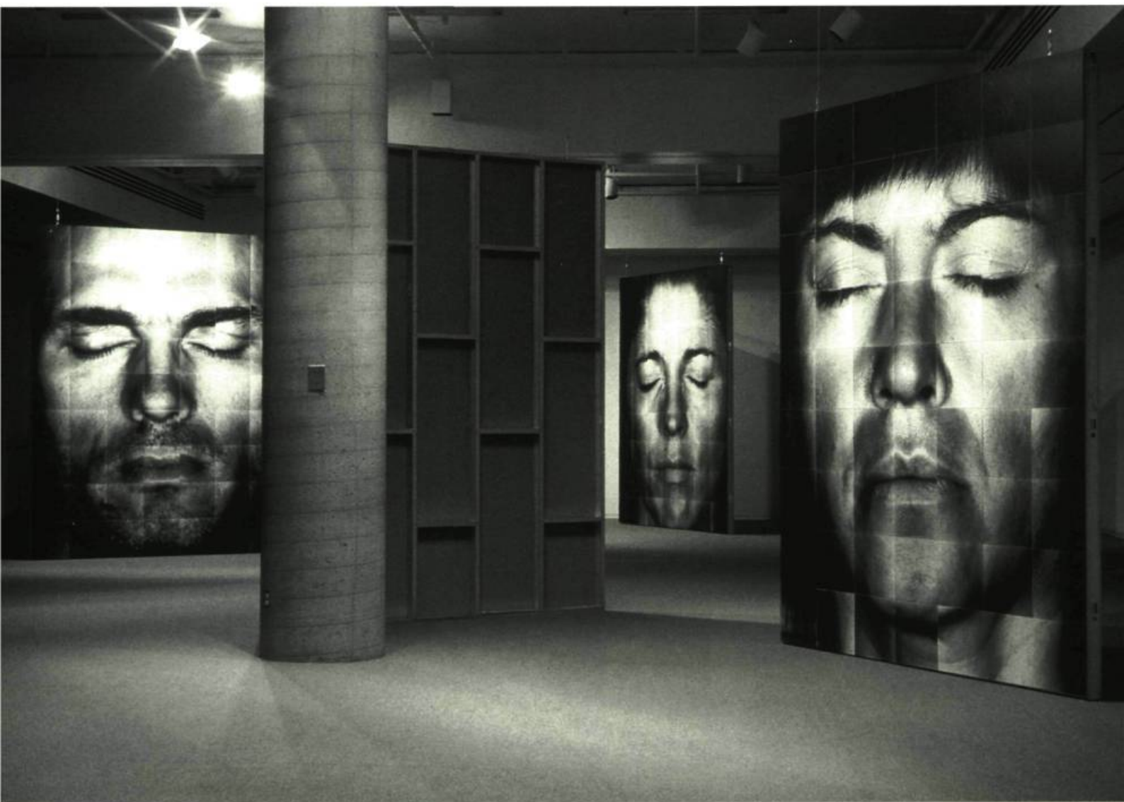
Série Les Écorchés, 1999 Galerie de l'UQAM

L ES RÉCENTS TRAVAUX DU PHOTOGRAPHE POUSSENT L'OBSERVATION ANATOMIQUE VERS DES DIMENSIONS ET PARAMÈTRES INÉGALÉS. SIMULATION OU DÉMESURE ?