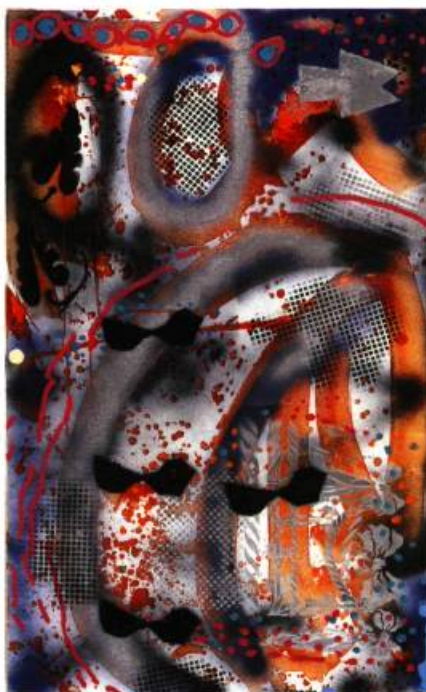
Demain l'an vingt mille, 1999 Acrylique sur toile, 76 x 122 cm

Les tableaux de l'exposition à la Galerie Bernard savent exercer une forte séduction esthétique leur permettant de traverser le rideau rationnel du spectateur pour atteindre son for intérieur. Soumis à leur vertu propre, ils défient toute analyse et réussissent l'immense défi d'amalgamer le caché et le visible. □