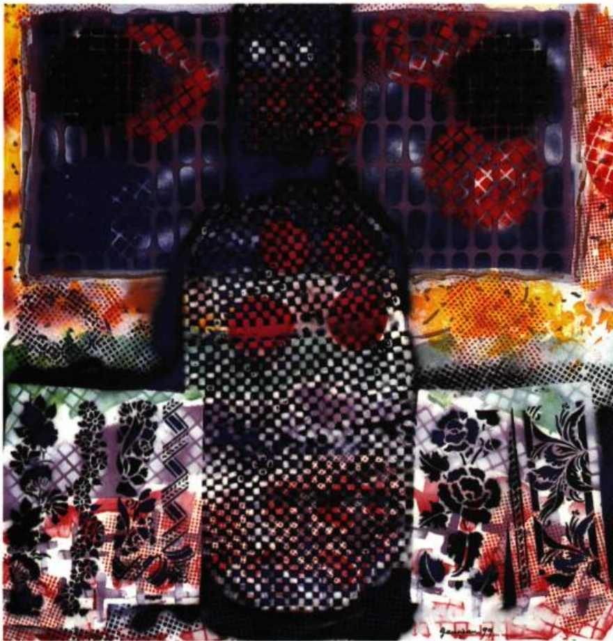
Gaudi est un coquin, 1999 Acrylique sur toile, 116 x 122 cm

On l'attendait ce retour de Pierre Gauvreau. Peintre qui occupe un rôle marquant sur la scène des arts au Québec depuis les années 40, il poursuit une œuvre toujours authentique dont on sait qu'elle n'a pas encore fini d'atteindre son ultime expression. Il veut parachever un travail entrepris autour d'une idée qu'il considère essentielle depuis sa découverte, l'automatisme . Son dévouement à cette pratique a fait que le peintre s'est tenu résolument à l'écart de la danse effrénée des modes et des styles si caractéristique de notre époque. Comme Cézanne, Monet, Matisse et bien d'autres qui ont mené leur art de façon consistante jusqu'à la fin, et ce à travers les mille et une tendances fourmillant autour de leurs ateliers, Gauvreau reste fidèle à lui-même. Nous ne pouvons que rendre hommage à cette intégrité intellectuelle.