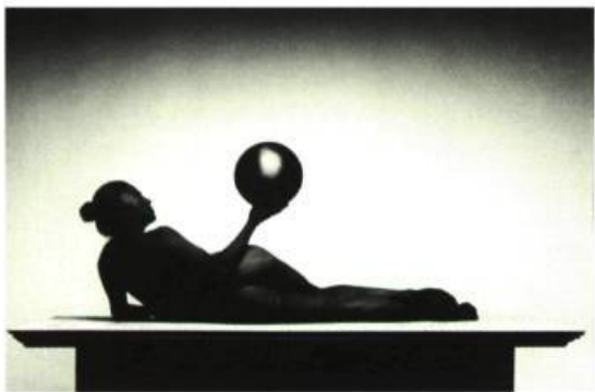
Pierre Charrier, Untitled 630 , 1996 photographie couleur, 20 1/4 x 7 1/4 pouces Musée des beaux-arts de Sherbrooke

C'est alors que le galeriste l'informe ne plus négocier aucune œuvre de l'artiste en question qu'il considère à présent comme mauvais. Désinvolture, maladresse ou naïveté de la part du galeriste? Inutile de porter ici un jugement qui ne nous apprendrait rien. Il