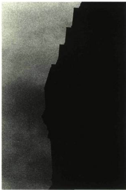
Aujourd'hui la nuit, 1999