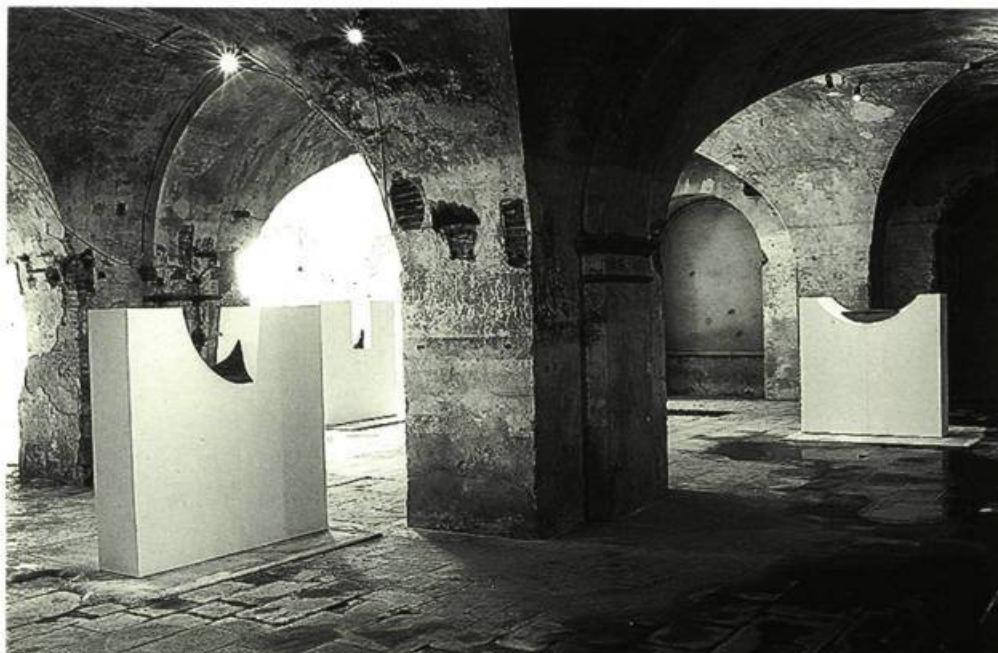
Œuvres de sable, 1999

Ainsi ces images étranges en rétention, restriction, réticence. En récession pour un flux froid: l'image qui flotte dans sa consistance et le regard en suspens au milieu de son vide, au milieu de sa conduite. Cette froideur (d'apparence) par excès de chaleur. L'œuvre qui se replie et ouvre à la fois. L'œuvre qui ne s'étend pas mais qui ne bouche pas pour autant afin de mieux piéger la lumière. Et voir par où ça passe.