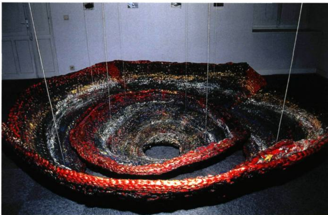
Continuum, 1995-1997 tresses de récupération, acrylique, polyuréthane, goudron, clochettes. Tressage, plastification et façonnage, 2 modules en mouvement, 300 cm diamètre.