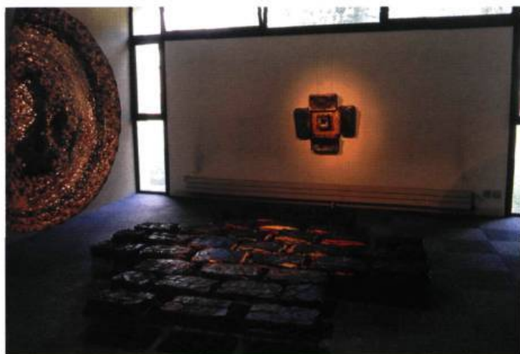
Lieux de rassemblement privé et public , 1993-95. Tissu de récupération et polyuréthane. Tressage et plastification.

C'est à mon sens là où réside l'originalité de la démarche de Carole Simard-Laflamme. Née d'un savoir-faire propre aux arts textiles, la virtuosité technique déployée dans le cycle De Natura permet d'enrichir la pratique contemporaine de la sculpture et de l'installation d'une réflexion matiériste très pertinente. □