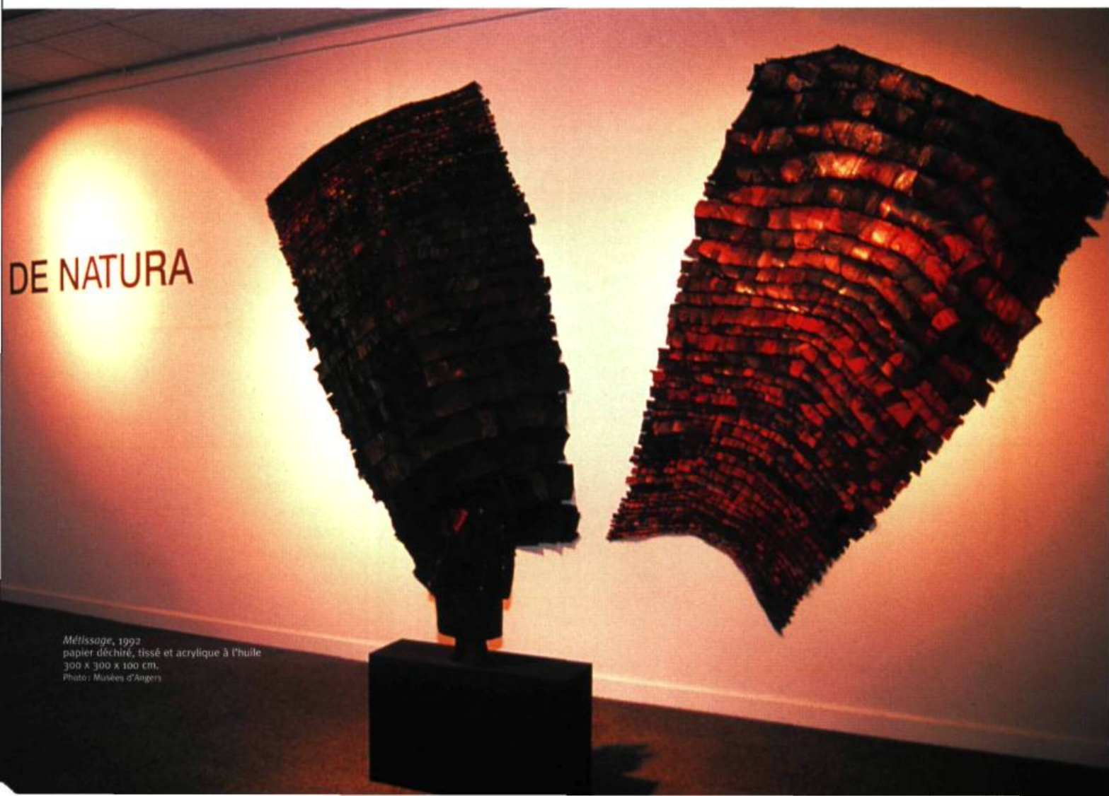
Métiissage , 1997 papier déchiré, tissé et acrylique à l'huile 300 x 300 x 100 cm.

« J E CROIS QUE L'HUMANITÉ EST TRESSÉE!», ÉCRIT CAROLE SIMARD-LAFLAMME DANS LA PRÉFACE DE L'OUVRAGE COLLECTIF QUI PRÉFIGURE LA SÉRIE D'EXPOSITIONS PRÉSENTÉE DEPUIS L'ÉTÉ 1997 AU QUÉBEC, EN BELGIQUE, PUIS EN FRANCE. MAIS DE NATURA EST BEAUCOUP PLUS QU'UN LIVRE ET QU'UNE EXPOSITION. IL S'AGIT D'UN ENSEMBLE DE QUESTIONS QUI TRAVERSENT LE TRAVAIL DE L'ARTISTE DEPUIS PLUS DE VINGT ANS.