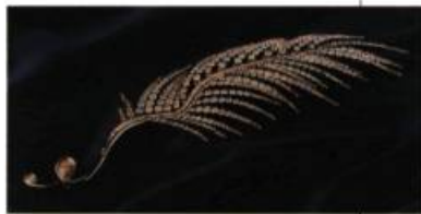
La plume de Cirano , Broche 348 diamants taillés poires et brillants ronds: 37,53 carats; or jaune 18 carats, platine et fil d'acier inoxydable Création: Annick Lucier

Du 10 avril 2001 au 6 janvier 2002 Diamants Musée de la civilisation 16, rue de la Barricade Québec (418) 643-2158 Site web: www.mcq.org