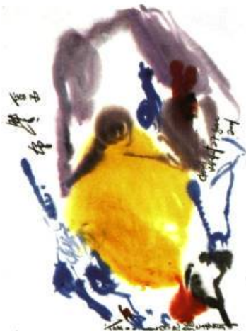
Chan Ky-Yut Aquarelle sur papier, 2001

et des écrivains d'Europe et d'Amérique à la galerie de l'Ambassade du Canada à Washington. Jusqu'au 31 mai 2001.