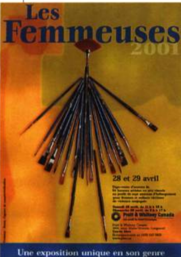
Une exposition unique en son genre