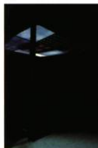
Orestes Grediaga Puits, 2000 Installation

L'œuvre intitulée Puits , un parallélépipède de grande dimension 4 x 4 x 3 mètres, est faite d'acier, aluminium, bois, lumière, son, vinyle, lecteur DVD, projecteur vidéo, haut-parleur et amplificateur. Image et son, perméables de par leur nature, s'allient aux matières solides et les déstabilisent. Le spectateur pénètre dans cette cage et se trouve sous une pluie d'images virtuelles qui se reflètent sur le plancher miroir. Il entre ainsi dans une expérience à la fois intellectuelle et sensuelle. L.R.