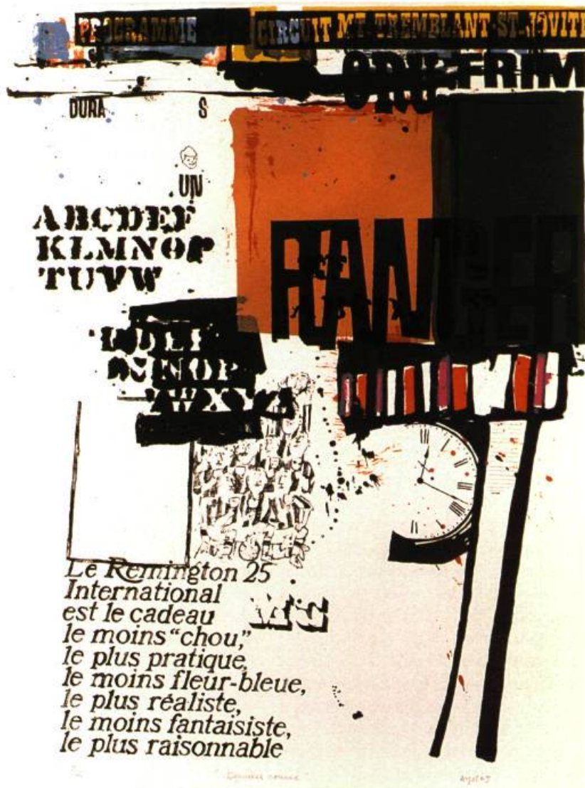
Dernière course, 1965 Lithographie, 65,5 x 50,4 cm Coll. Madeleine Forcier © Succession Pierre Ayot / SODART 2001

Alors que les premières années de la décennie 60 consacrent la vitalité du mouvement pictural issu de l'automatisme, que l'abstraction géométrique néo-plasticienne domine la scène artistique, l'existence même de la peinture, comme sa légitimité sont fortement remises en question par une nouvelle génération d'artistes. A l'ère des nouvelles technologies, des communications de masse, la peinture comme le tableau de chevalet apparaissent comme une « technologie dépassée », l'abstraction comme un nouvel académisme. Le rôle de l'artiste, la fonction traditionnelle de l'art comme celle des institutions sont à réévaluer. L'art est affaire de communication, les mots d'ordre sont : démocratisation, intégration et participation. L'art québécois n'échappe pas à l'effervescence qui marque la scène internationale.