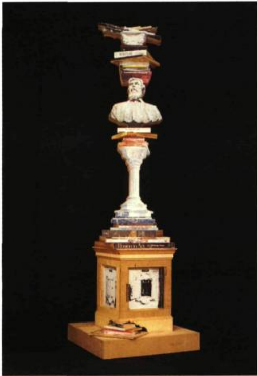
Les grandes aventures de Benvenuto Cellini, 1989 560 x 103 x 103 cm

éléments de l'art et de la vie quotidienne, sans résolution» 4 . Par ses monuments, ce sont les relations problématiques et les frontières incertaines entre art et culture qu'il interroge. Quelles formes, quelles frontières doit-on donner à l'espace de la culture? se demande Sherry Simon. «Du découpage, des contours que l'on donnera à cet espace, écrit-elle, dépendra le genre de savoirs, de valeurs, d'identité que l'on retrouvera.» 5