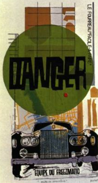
Faites-le vous-même, 1965 Lithographie, 76 x 56 cm

Depuis la position particulière qu'occupe le Québec sur la scène internationale, en marge des grandes capitales où se définissent les enjeux et les diktats, la nouvelle génération d'artistes québécois inventera les solutions à la mesure des problèmes qu'ils rencontrent, des préoccupations qui sont les leurs. Refusant toute forme d'embrigadement idéologique – c'est à l'enseignement de l'art expérimental, de l'aventure renouvelée que s'inscrit toute une génération d'artistes. «Aujourd'hui, affirme Serge Lemoyne en 1967, il n'y a plus d'écoles. On se rattache à des courants, oui, à des courants internationaux, on poursuit des expériences qui ont été menées ailleurs, avant.» Et Jean-Claude Lajeunie d'ajouter: «On en a fini avec les croisades, c'est peut-être ce qui nous distingue des générations passées.» 2 C'est par le jeu et l'humour que cette nouvelle génération mènera l'offensive contre l'esprit de sérieux, qu'elle manifestera une attitude anti-autoritaire. Cette «nouvelle sensibilité» est devenue une praxis, une forme de lutte contre la culture supérieure qui monopolise les valeurs de vérités de l'esthétique, la revendication de types et de formes de vie nouveaux. «En l'absence de ces qualités, écrivait Marcuse dans son essai Vers la