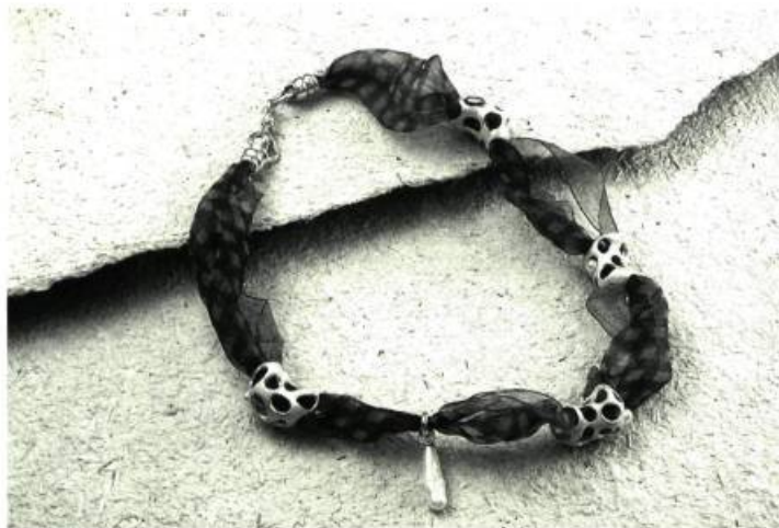
Josée Desjardins Argent sterling, émail et soie.