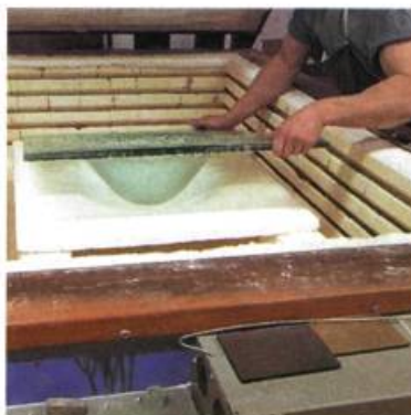
Hectarus™, produits verriers Lavabo Elenali