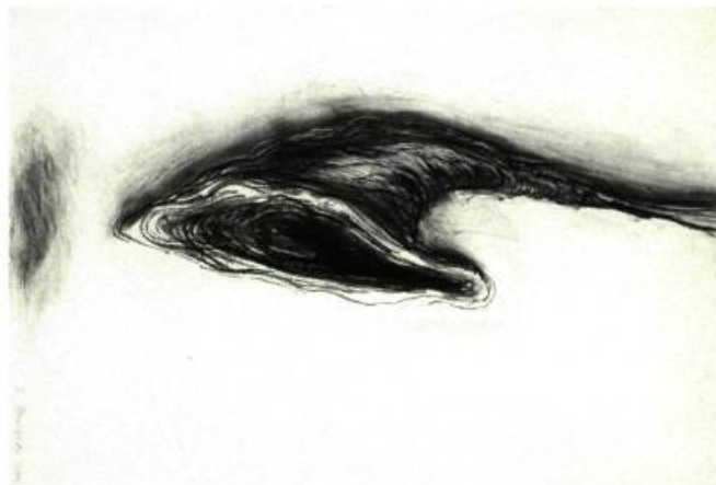
Ludmila Armata CYCLE: PARTIE #2, 2000 Fusain. 100 cm X 75 cm

Œuvre collective La marée aux mille vagues , 2001 610 mètres de long Musée du Bas-Saint-Laurent