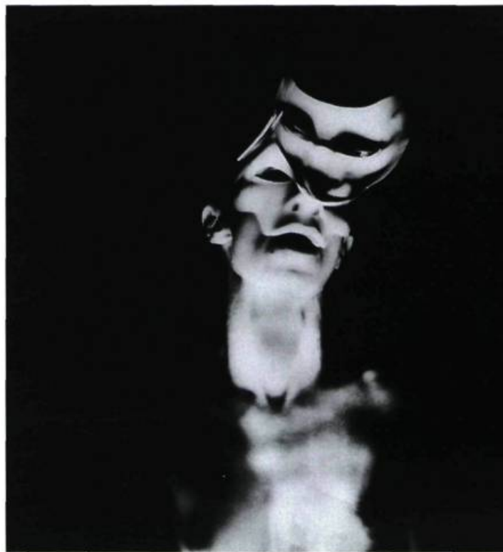
Sans titre (Masque) Épreuve argentique

Bien que l'ensemble de son œuvre soit très personnel, la photographe tient à ce que ses créations ne soient pas confondues avec une documentation purement autobiographique. Le choix du noir et blanc, au caractère essentiellement monochromatique qu'elle associe