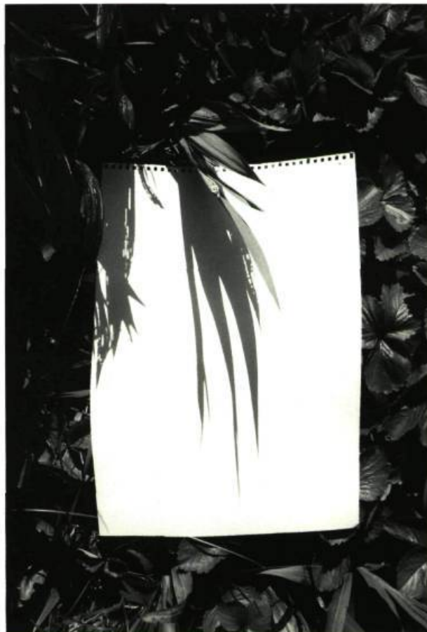
Arborescences (2000-2001) Série: La nature invisible Tirage chromogène 61 x 91,5 cm