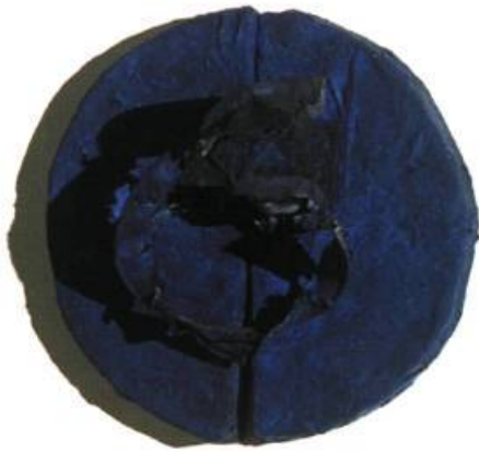
Tourbillon en bleu, 2001 Papier, acrylique Trois cercles : d = 40 cm