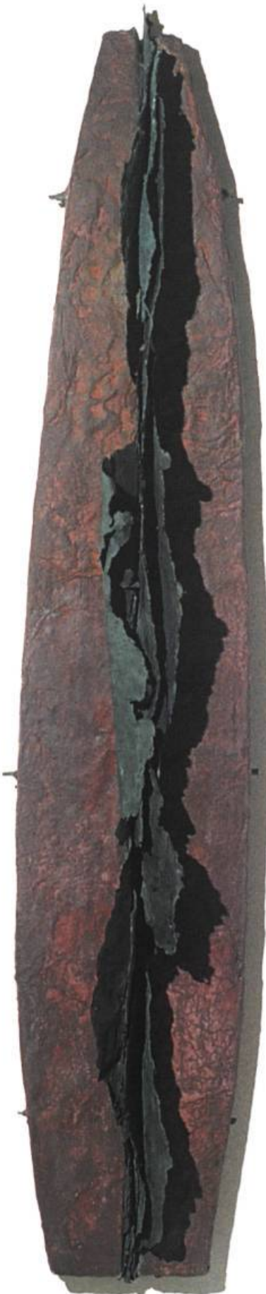
Ondulatoire vert Papier, acrylique 126 x 30 cm