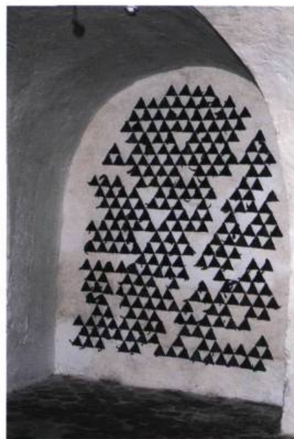
Installation à la crypte de l'église Saint-Martin, 1999 (Saint-Laurent d'Orsay, France) Vue de l'ensemble

À la galerie Graff, l'ensemble de petites pièces (33 x 22 cm) intitulé Suite de 7 , créé pour une exposition à l'Atrium de Chaville l'année dernière, met bien en relief le lien entre les tendances actuelles de l'artiste. Il conjugue en effet la légèreté du matériau avec une surface à double volet où chaque élément posé au mur avec ses ombres projetées est revêtu de deux couleurs qui, juxtaposées dans leurs contrastes, déclenche un rythme qui ponctue l'installation. Avec Ondulatoire violet , quadriptyque (les nombres pairs sont rares chez Isabelle Leduc) qui couvre plus de 5 mètres, l'artiste s'est amusée à y construire des corolles légères