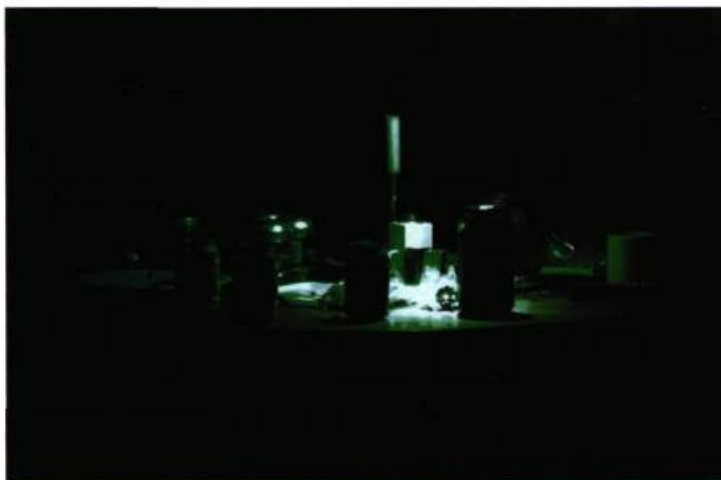
Nicolas Baier Absinthe , 2003 Papier mat (tirage lambda) 122 x cm x 183 cm Montage à froid sur aluminium, laminé mat

L'aspect cubiste de ses images, présentées lors de la Biennale de Montréal, Lundi, 05-06-07, Octobre (2000), domine. Une simple chambre à coucher – offrant au regard une superposition d' éléments désynchronisés –, exige néanmoins une observation attentive pour en apprécier les détails.