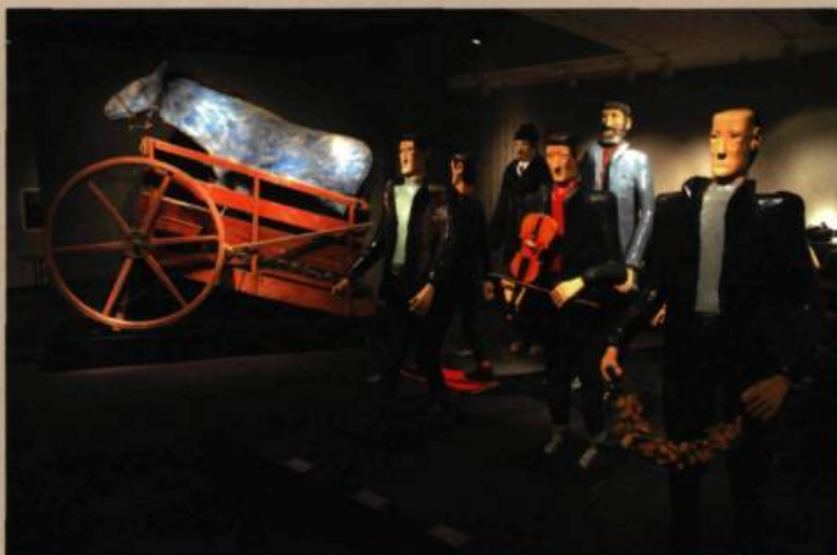
Le Cheval bleu

Mario Del Curto. Une bande vidéo et sonore permet de découvrir les œuvres mystérieuses qu'il a ancrées aux cavités rocheuses de la