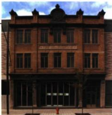
Galerie d'architecture MONOPOLI 181, rue Saint-Antoine Ouest, Montréal Tél.: (514) 238-5859