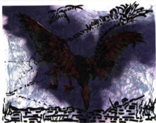
Touché , 1981 Lithographie, H.C., 66,5 x 79,5 cm. Collection du Musée national des beaux-arts du Québec. Don de l'artiste (2002.39). © Succession Jean-Paul Riopelle / SODRAC (Montréal) 2005.

Pour accompagner le lancement du troisième tome du Catalogue raisonné de l'œuvre de Jean-Paul Riopelle (volume consacré aux estampes de l'artiste), la galerie Simon Blais présente une exposition de gravures composée notamment d'une douzaine de gravures inédites, ainsi que d'estampes significatives des grands moments de création de Riopelle. Parallèlement, sont accrochées quelques-unes des peintures (techniques mixtes) provenant des séries produites en 1967, 1970, 1971-1972 et 1983-1989 ayant pour support les estampes: collages de lithographies, Ficelles , Oies sauvages et compositions proches de l'esprit de l' Hommage à Rosa Luxemburg . Cette exposition intitulée Estampes et Mutations sera accompagnée d'un catalogue original comportant une étude de Marine Van Hoof, historienne de l'art, mis en page par Martin Dufour, designer visuel.