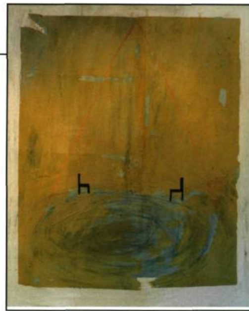
Absences , 2005 acrylique, huile et collage sur bois, 153 X 121 cm