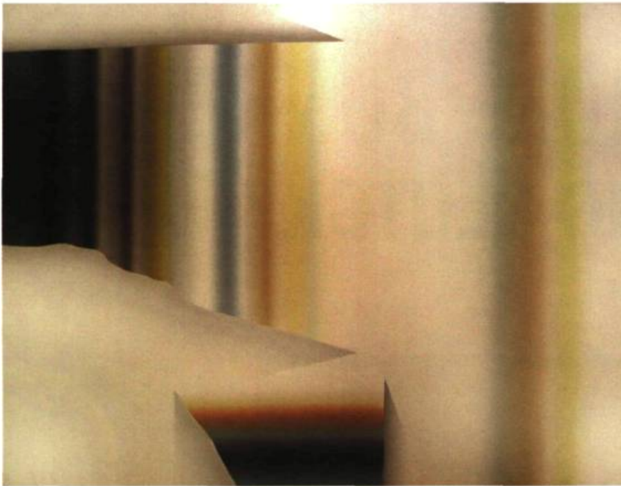
Stretto e Finale, 1968 Huile sur toile 114 X 146 cm