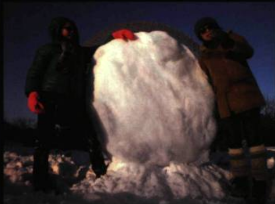
Diane Borsato Eclipse, Wednesday February 21, 2007