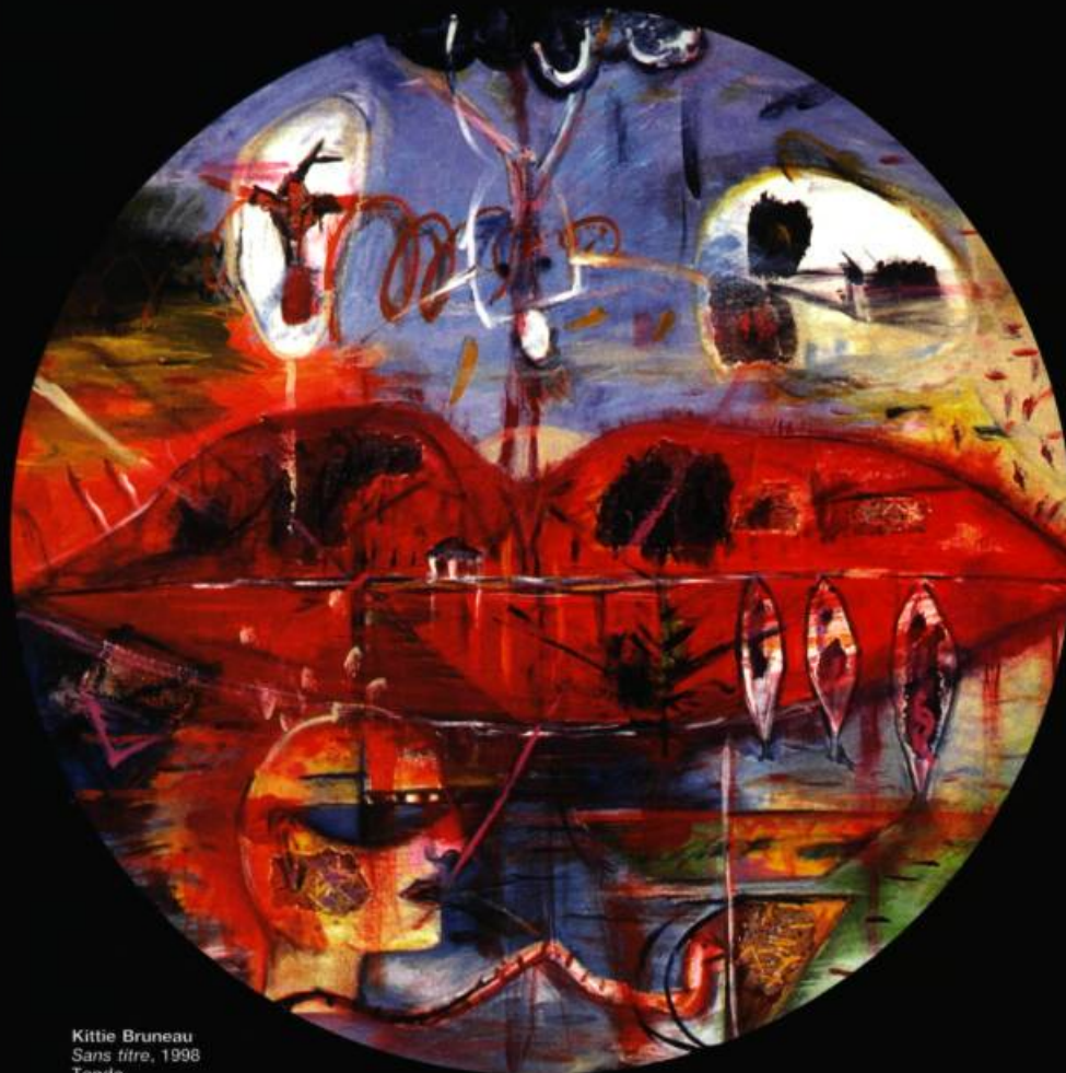
Kittie Bruneau Sans titre, 1998 Tondo Acrylique sur toile D 120 cm

TROIS EXPOSITIONS MAJEURES VONT METTRE EN VEDETTE LA COLLECTION D'ŒUVRES D'ART