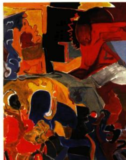
Léopold Plotek High Windows, 1999 Huile sur toile H 160 x L 123 cm

tueux d'avancer qu'aucun établissement voué à la mise en valeur d'objets d'art (ni musée, ni galerie indépendante) ne se soit risqué jusqu'ici à offrir un tel panorama? Modeste, Louis Pelletier ne va pas jusqu'à parler de panorama. Il avance comme raison que la Collection comporte encore bien des lacunes. Il s'emploie justement à les combler en guettant les occasions d'acquérir des œuvres qui donneraient une plus juste idée des mouvements qui ont marqué l'art moderne et contemporain du Québec. Or, justement, Nomade témoigne un peu de cette quête.