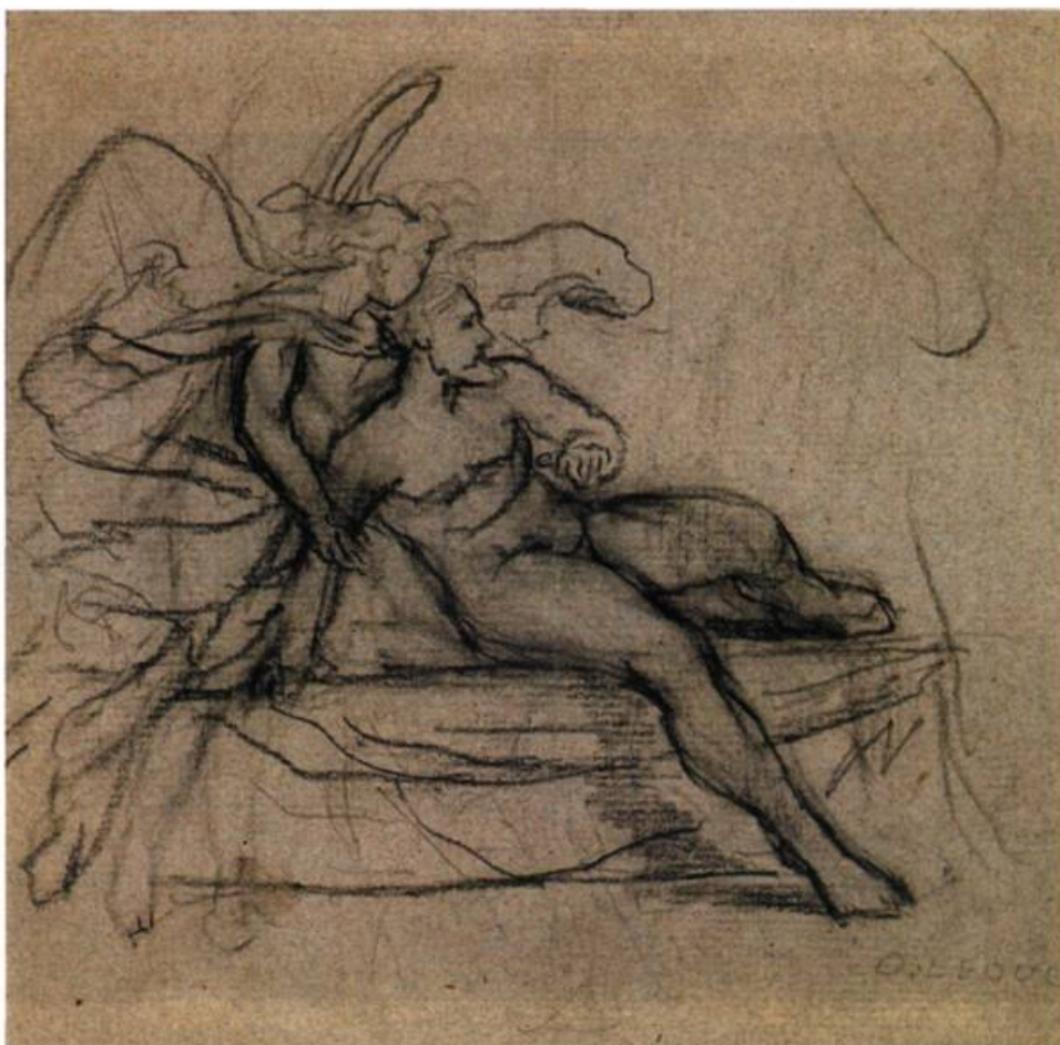
Ozias Leduc Étude, 1896 Crayon sur papier H 41,5 x L 40,5 cm

La Collection Loto-Québec comporte près de 4000 œuvres d'art. En sélectionner une centaine a représenté une tâche délicate pour Louis Pelletier. « Un nombre aussi restreint ne saurait être représentatif de l'ensemble de la Collection », admet-il. Mais ce n'est pas tant la représentativité qui lui tient à cœur que le souci de demeurer fidèle à l'esprit qui, au fil des années, a guidé le choix des acquisitions qu'il a supervisées. Il rappelle qu'avec l'accord des dirigeants de Loto-Québec, il