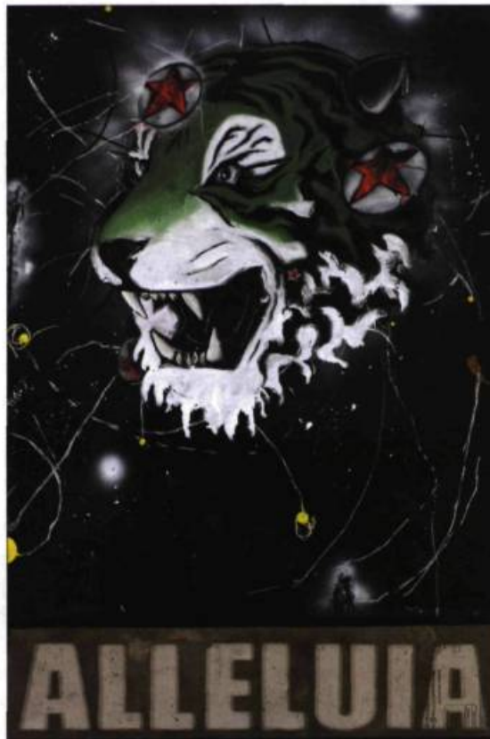
Sylvain Bouthillette Alleluia, 2007 Techniques mixtes 187 x 126 cm

Le résultat des activités de collecte d'Alain Tremblay semble de prime abord assez hétéroclite, voire chaotique. Plusieurs œuvres se côtoient plus ou moins harmonieusement. Toutefois, le titre Sublime Démesure , particulièrement bien choisi, donne quelques pistes d'appréciation qui réintroduisent du sens dans une désorganisation qui