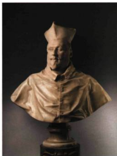
Portrait du cardinal Scipion Borghèse, seconde version, 1632 Marbre Galleria Borghese, Rome